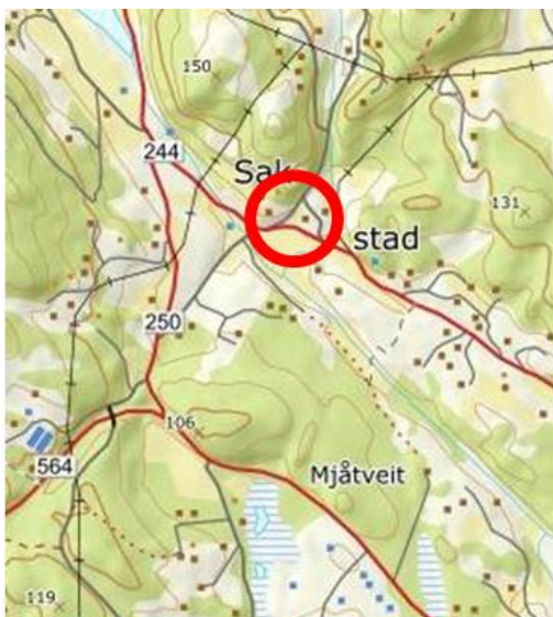
Situasjonskart over område

BNK Eiendom AS har søkt om om etablering av ny avkøyrsel frå GBNR 18/92 til kommunal veg Øvre Sagstad.