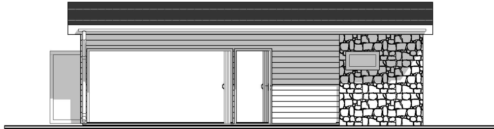
1:100 Fasade Øst