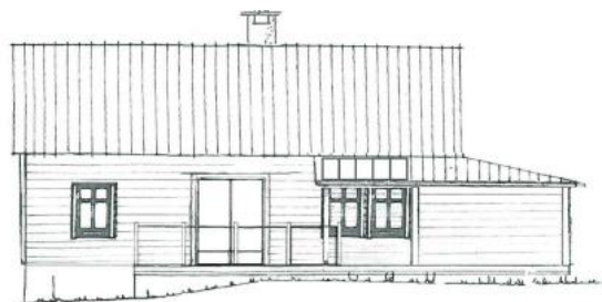
Fasade mot SYD

Tiltaket skal prosjekterast og utførast slik at det etter kommunen sitt skjønn har gode visuelle kvalitetar både i seg sjølv, og i høve til tiltaket sin funksjon, bygde og naturlege omgjevnader og plassering, jf. pbl. § 29-2.