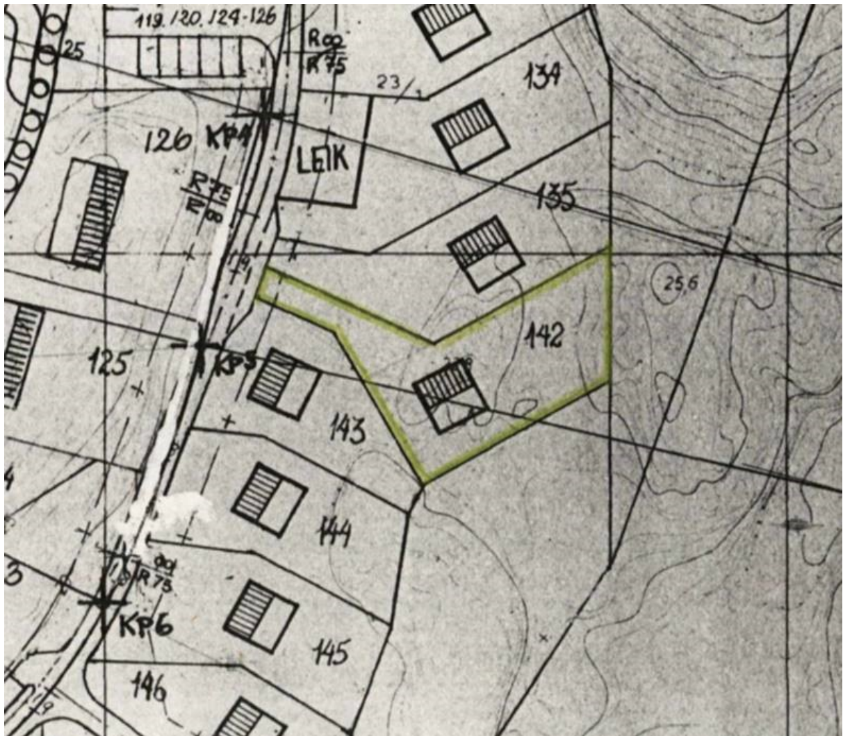
Kart frå byggesaka for 23/325 (1981), som viser vegtilkomst til tomt 142. Det står i søknadsskjemaet at tomta har adkomst til kommunal veg og tilkomst er farga gult.