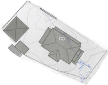
Utsnitt av situasjonsplan og plassering av tiltak vedlagt søknad: