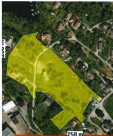
Området etter vurdering