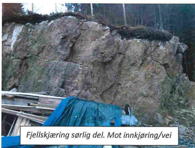
Fjellskjæring sørlig del. Mot innkjøring/vei

Slik jeg ser det, er det ingen umiddelbar fare for at store blokker skal gli ut. Utover at det anbefales at skjæringen renses og spyles ren, vil et eventuelt sikringsarbeid av skjæringen bli svært omfattende og kostnadskrevenende. Sannsynligvis vil det medføre forringing av tilstøtende eiendom, samt omfattende bolting og netting av veggen. Det finnes flere tilsvarende usikrede skjæringer i området