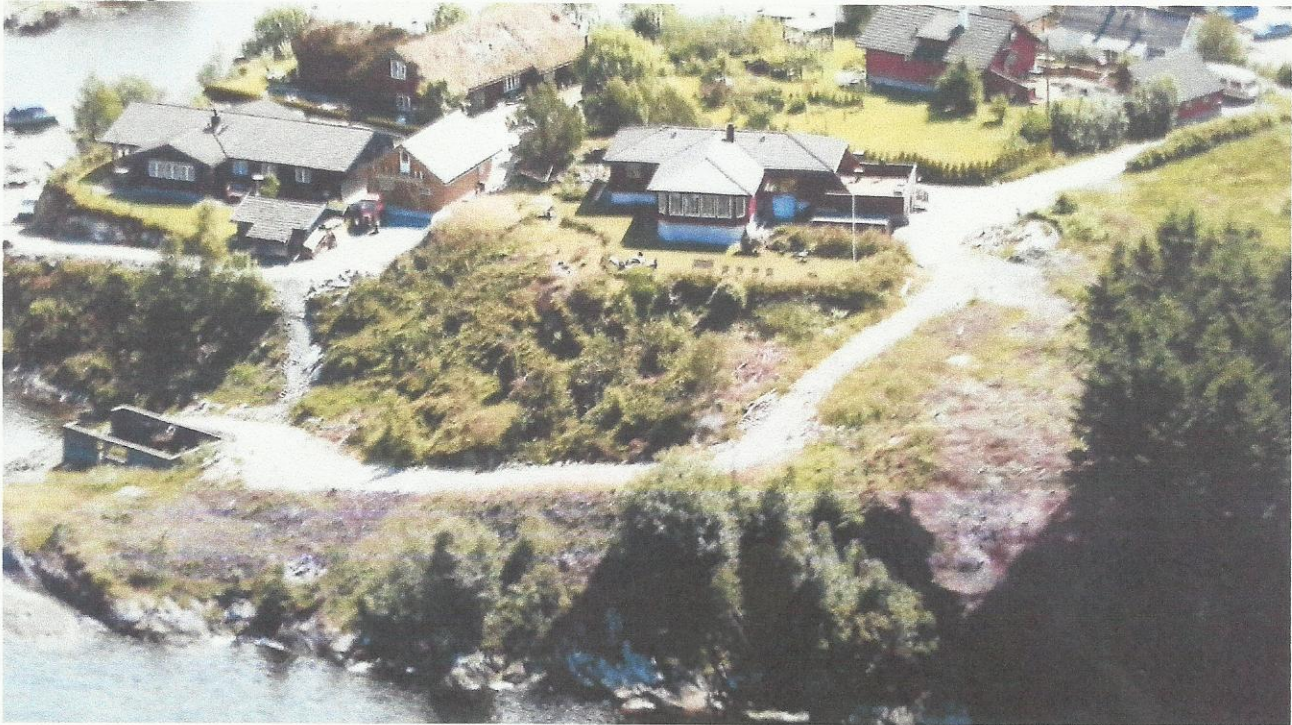
Når en ser størrelsen på tiltakshaver eiendom så skulle det være helt unødvendig å bygge garasjeanlegget innover grensen til naboen. Se også bildet under med grensene markert.