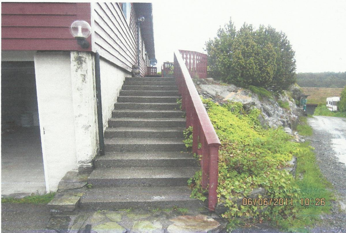
Dette bilet viser også at garasjen er bygd opp først og deretter latt tak oppå.