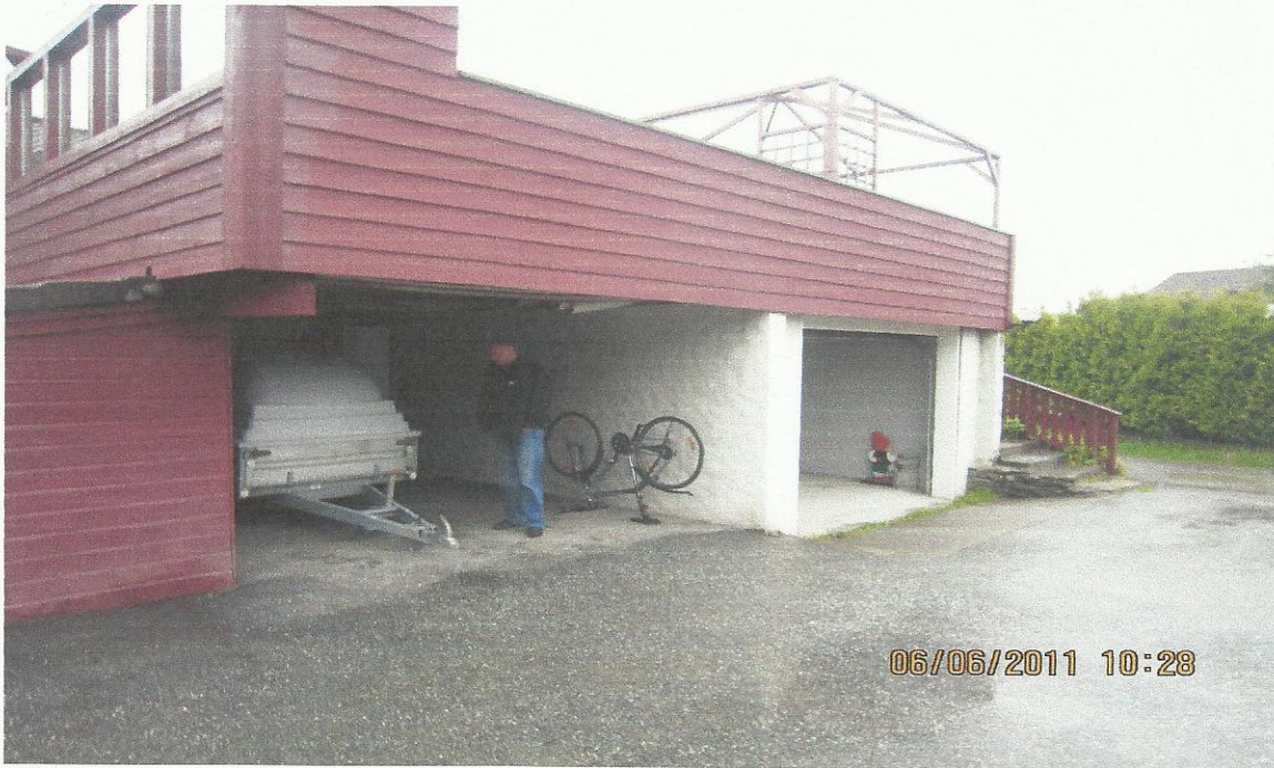
Dette bildet viser det faktiske forholdet at garasjen er bygget opp i mur og deretter lagt flatt tak oppå.