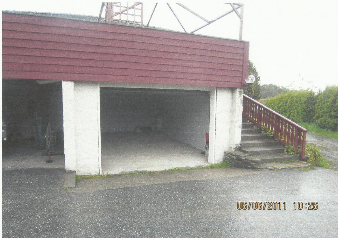
Garasjen er ble bygd først og deretter lagt flatt tak oppå, brukt som terrasse.