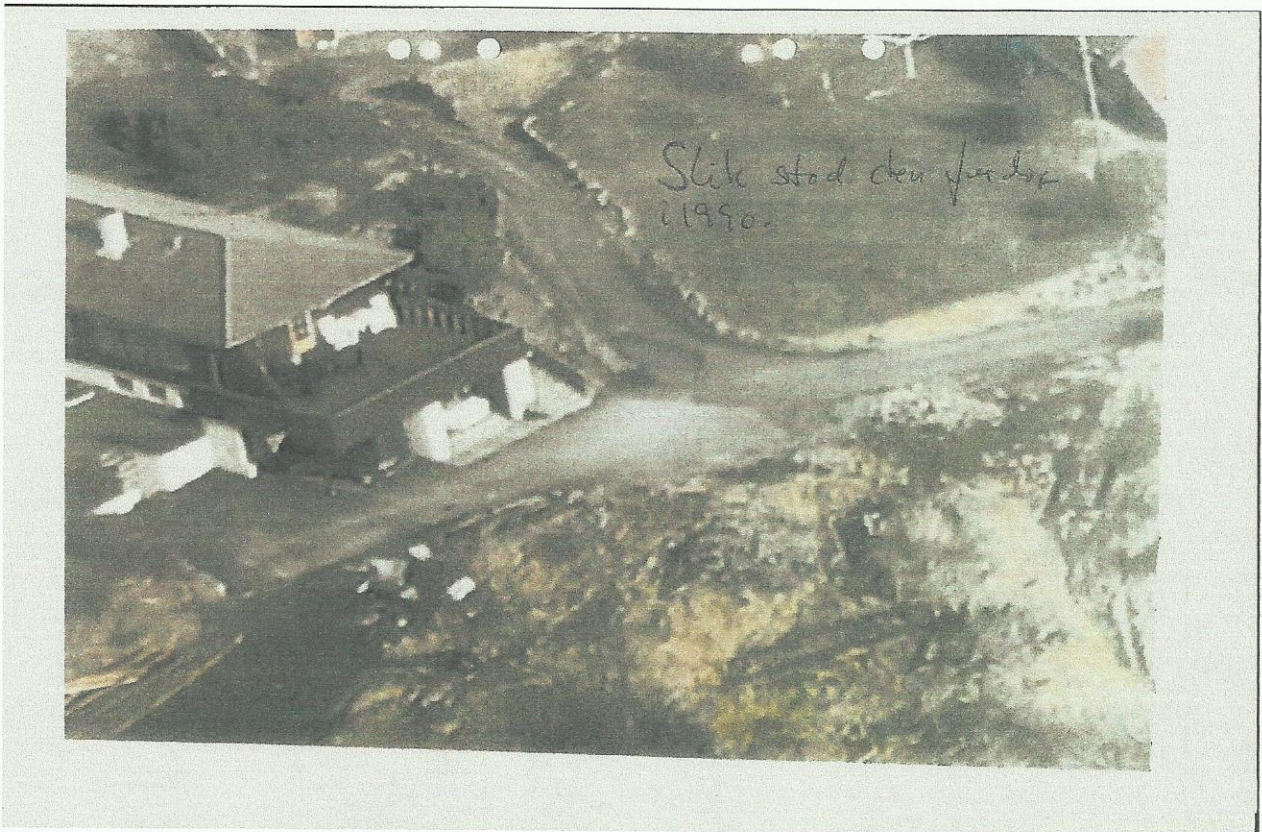
Garasjeanlegget utgjør en stor del av boligen, trykket opp mot og over eiendomsgrensen.