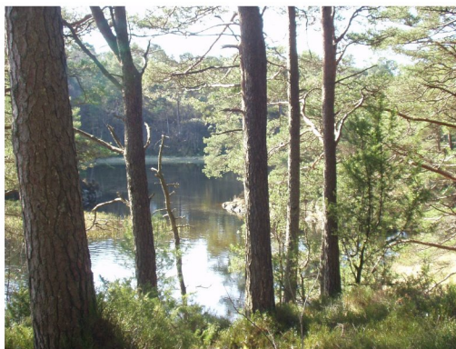
- ved nedre Sjevlo