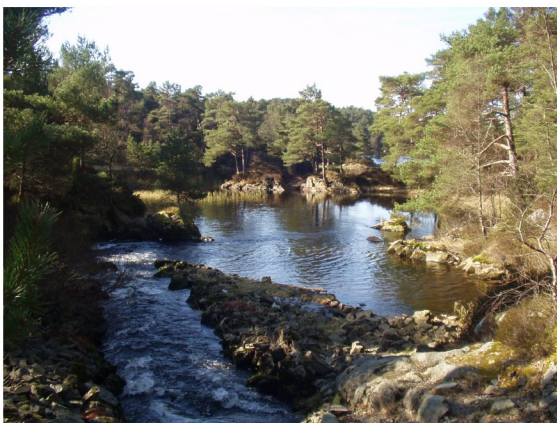
- ved nedre Sjevlo