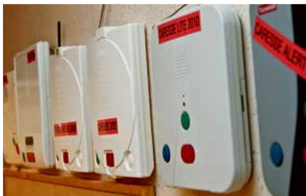
Rakel fungerar med alla de modeller av modem, både analoga och digitala, som används i Östersunds kommun.