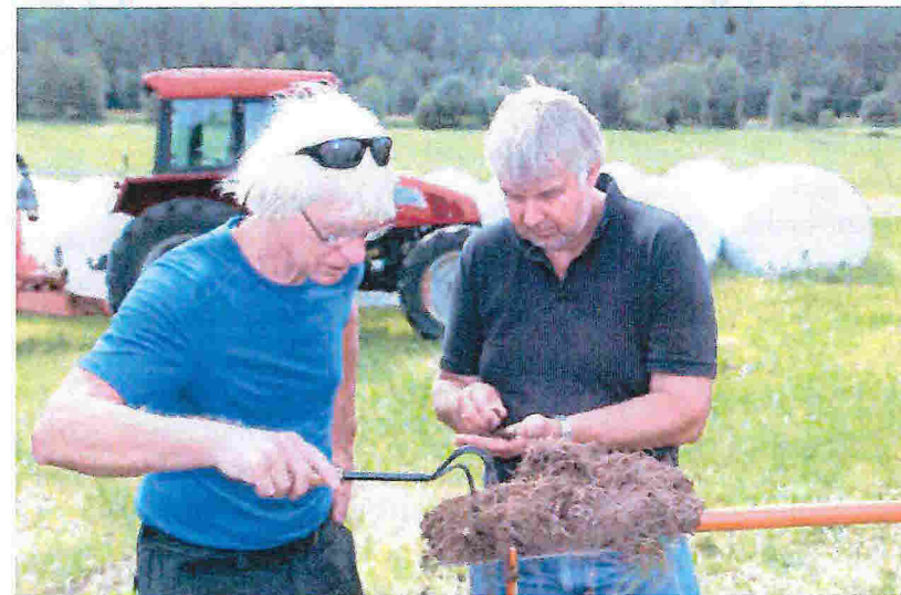
Rådgiverne studerer jordstruktur