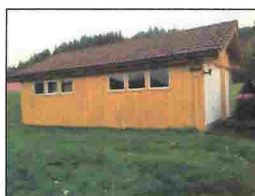
Eksisterende garasje, sørves

Eksisterende tilbygg ombygges og utvides