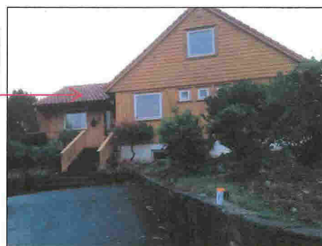
Eksisterende hovedinngang, vest