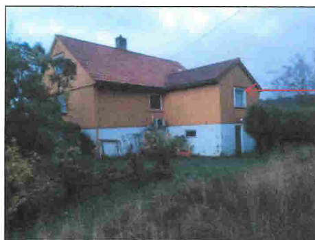
Eksisterende enebolig, nordøst

Eksisterende tilbygg ombygges og utvides