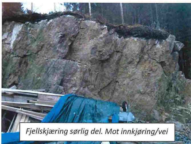
Fjellskjæring sørlig del. Mot innkjøring/vei

Slik jeg ser det, er det ingen umiddelbar fare for at store blokker skal gli ut. Utover at det anbefales at skjæringen renses og spyles ren, vil et eventuelt sikringsarbeid av skjæringen bli svært omfattende og kostnadskrevenende. Sannsynligvis vil det medføre forringing av tilstøtende eiendom, samt omfattende bolting og netting av veggen. Det finnes flere tilsvarende usikrede skjæringer i området