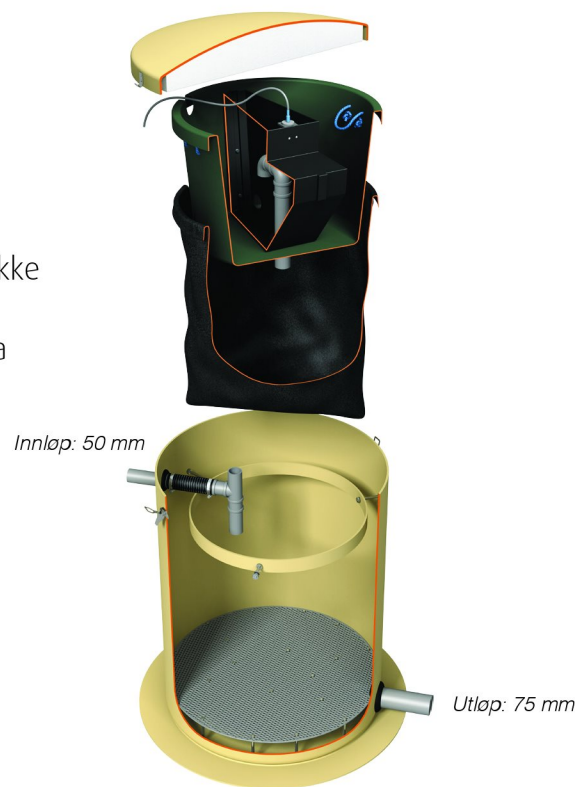
Vera Slamfilter for gråvann uten pumpe Varmekabel er ekstrautstyr.