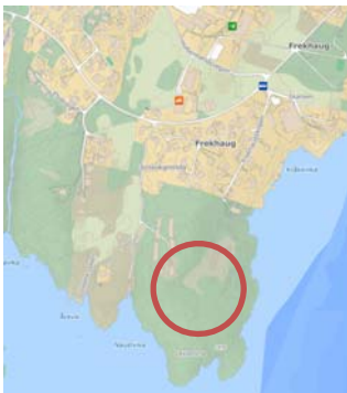
Illustrasjon viser byggetomt med rødt.

Det er planlagt med nedgravd løsning for restavfall og papir/papp, og sekkeinnsamling av plast. Sekker vert plassert ved container nedkast på markert plass. Glas og metall vert levert på nærmeste returpunkt XX.