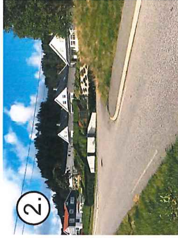
2. Fra Sagstadvegen 107 begynner fortau ved innkjøring til feltet