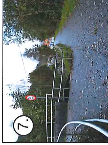
7. Fortau fra bro til Frekhaug