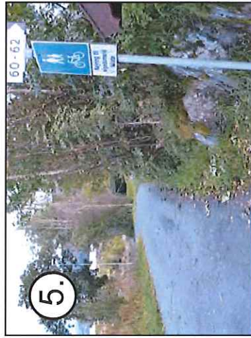
5. Gang og sykkel nedover igjennom Langeland