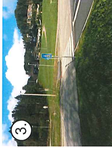
3. Det er 30 sone og fortau helt bort til Sagstad Skule og Meland Aktiv, med merket overgang