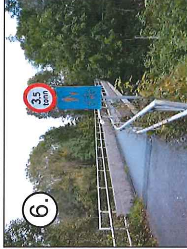
6. Gang og sykkelbro over Fylkesvei 564 til Frekhaug Senter