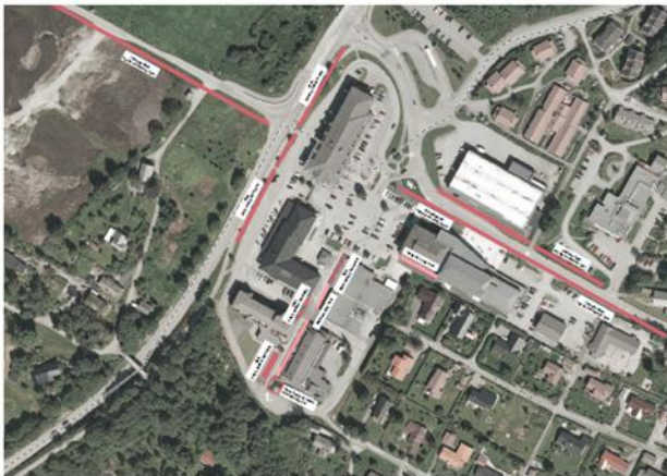
VEGETASJON STRATEGI 1. Forsterke aksen fra skogen inn mot torget. 2. Beplanting langs husveggene med stedspecifikk natur. 3. Erstatte gressplasser med lynghei og utmarksplanter. 4. Sykkeli- og gangsti i aksen fra fjorden opp mot skolen