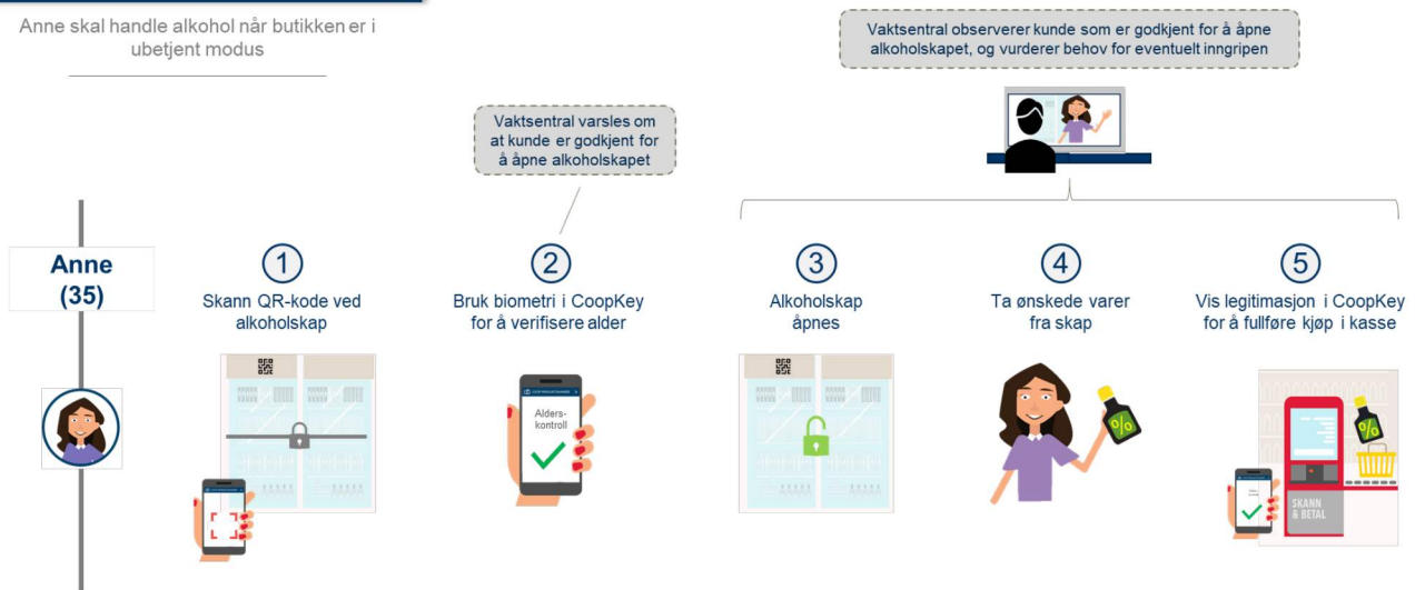
Figur 2 - Kundereise - ubetjent alkoholsalg for personer som er 18 år eller eldre

Anne skal handle alkohol når butikken er i ubetjent modus