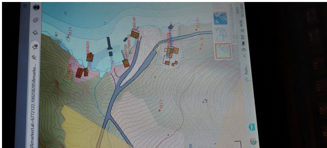
Bilde fra dataskjermen