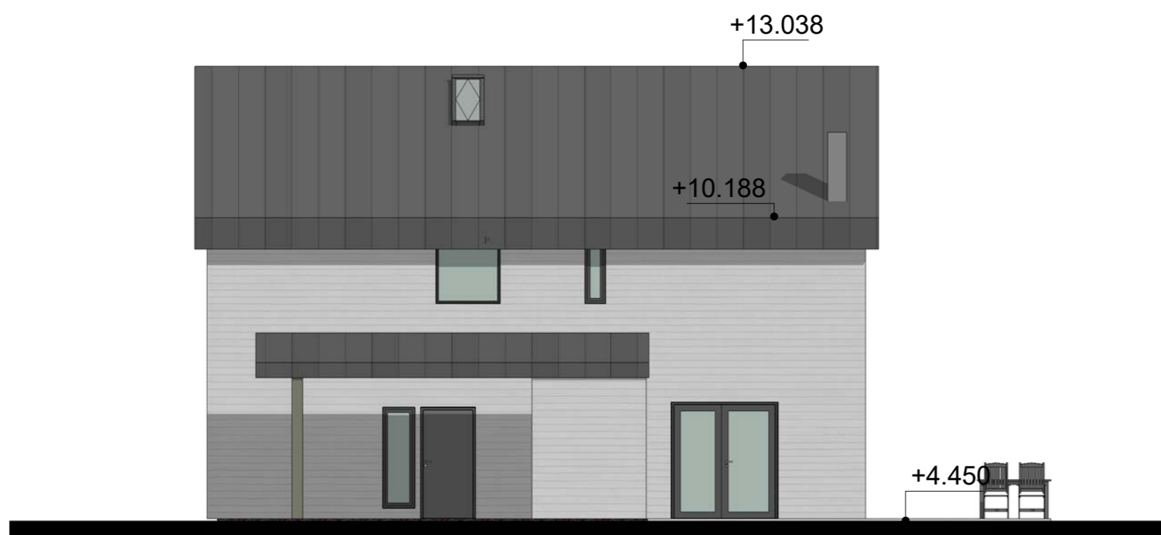
1 Sør-vest 1 : 100