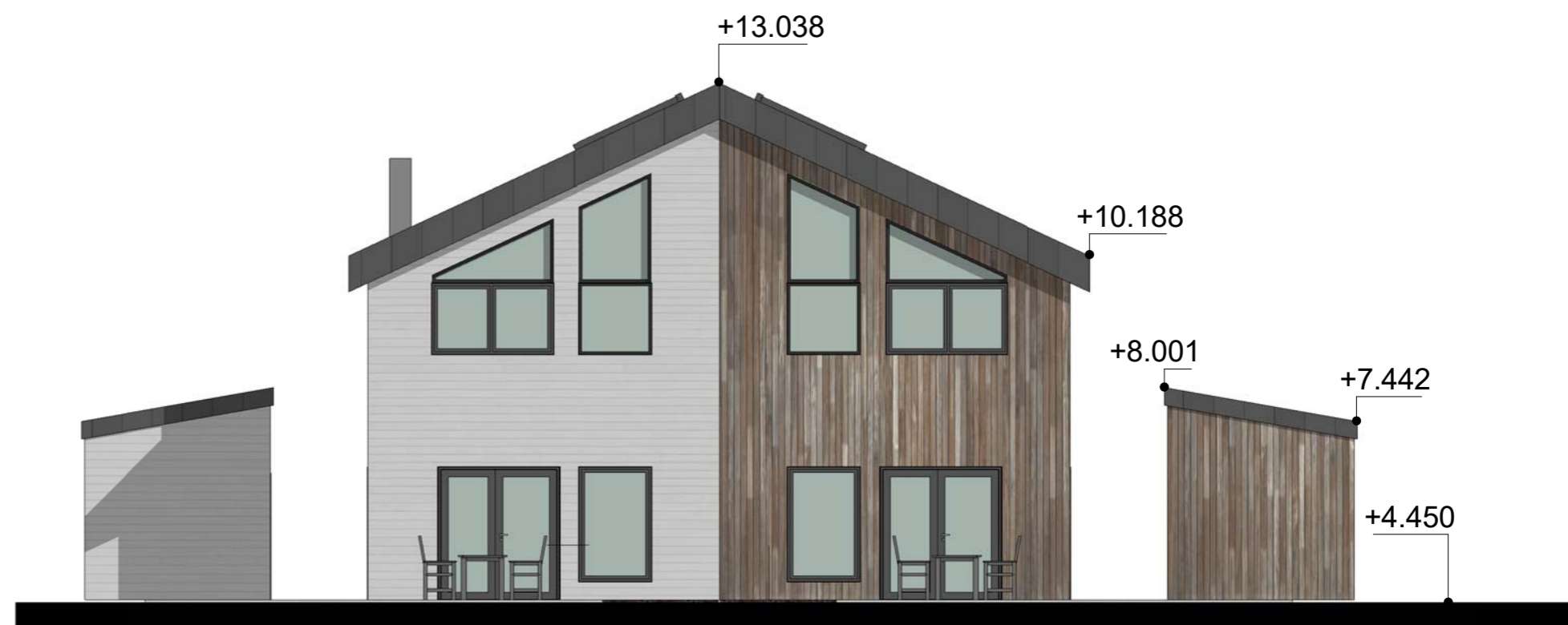
3 Syd-øst 1 : 100