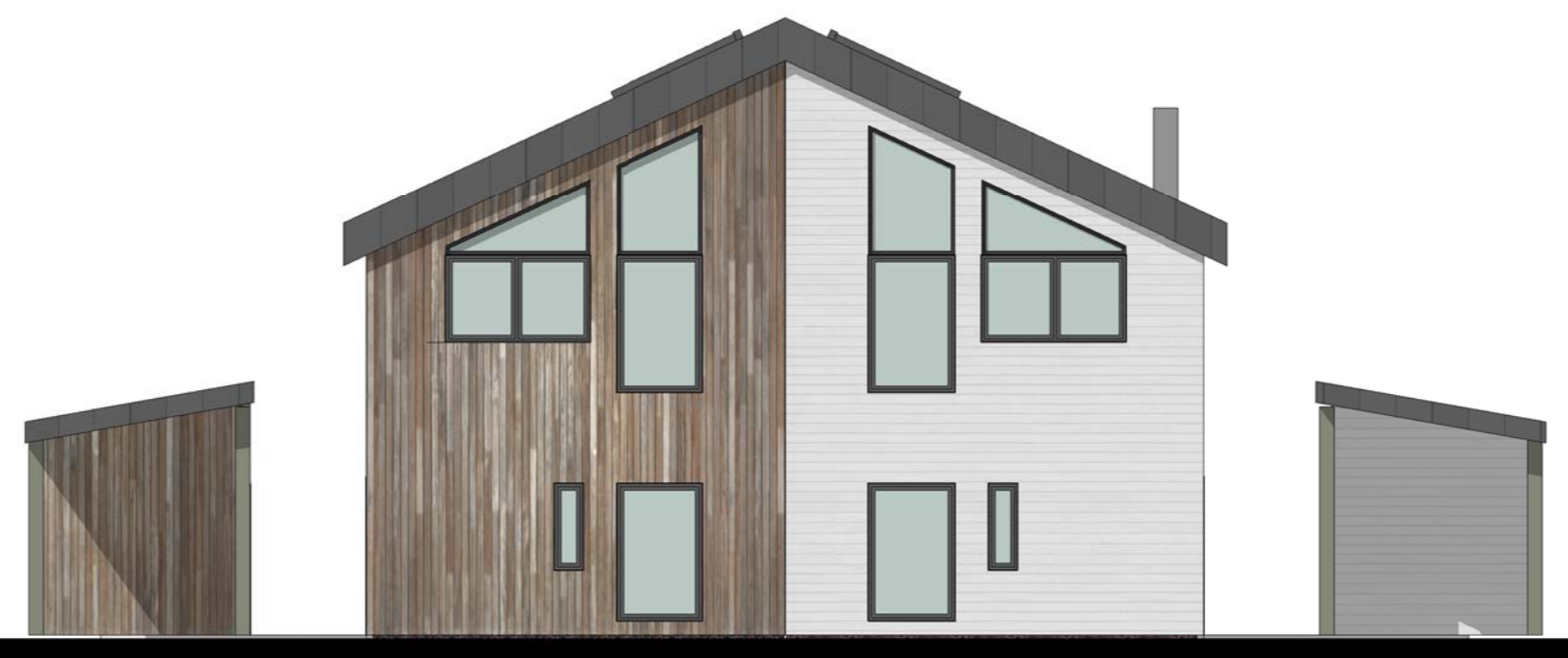
2 Nord-vest 1 : 100