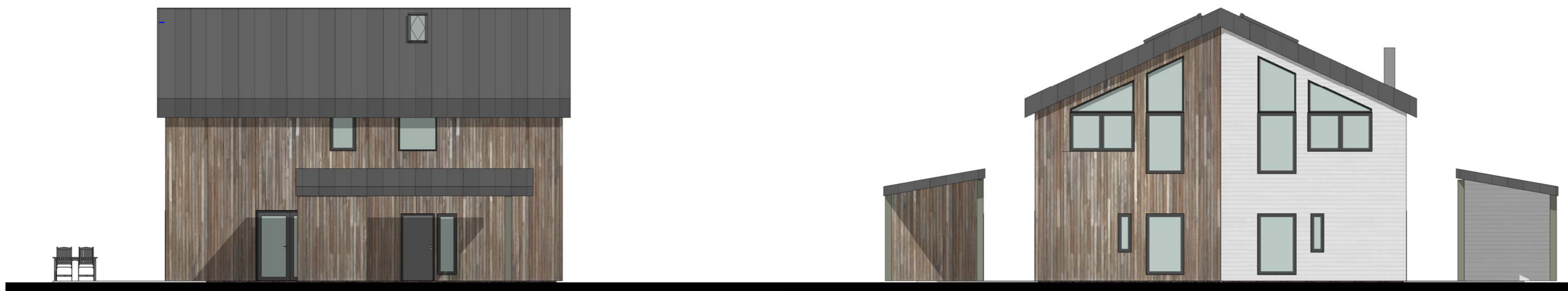
4 Nord-øst 1 : 100