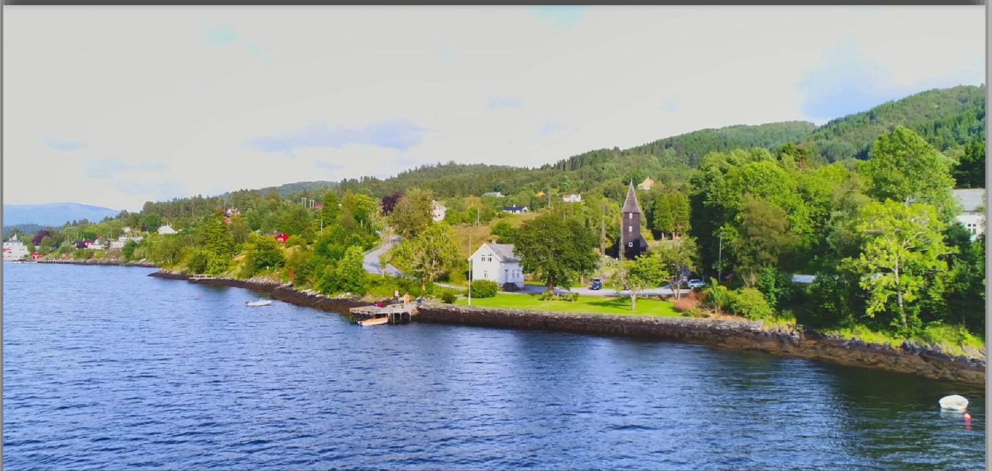
Hamre Kyrkje.

Trykk her for å lese Budsjett 2024 og Økonomiplan 2024-2027