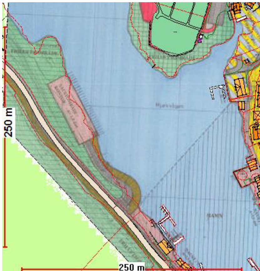
Utsnitt frå gjeldande reguleringsplan

Eit av føremåla med reguleringsplanen er «Å sikre verneverdige bygg og anlegg i Hosanger sentrum». Eigedommen ligg i regulert område innanfor det som i reguleringsplanen for Hosanger sentrum er definert som byggeområde - naustområde/kontor. Sjøarealet er definert som offentlege trafikkområde - hamneområde i sjø. Før handsaming av byggeløyve er det krav om å utarbeide detaljert plan for felt med blanda føremål, jf. reguleringsføresegn § 2.3.