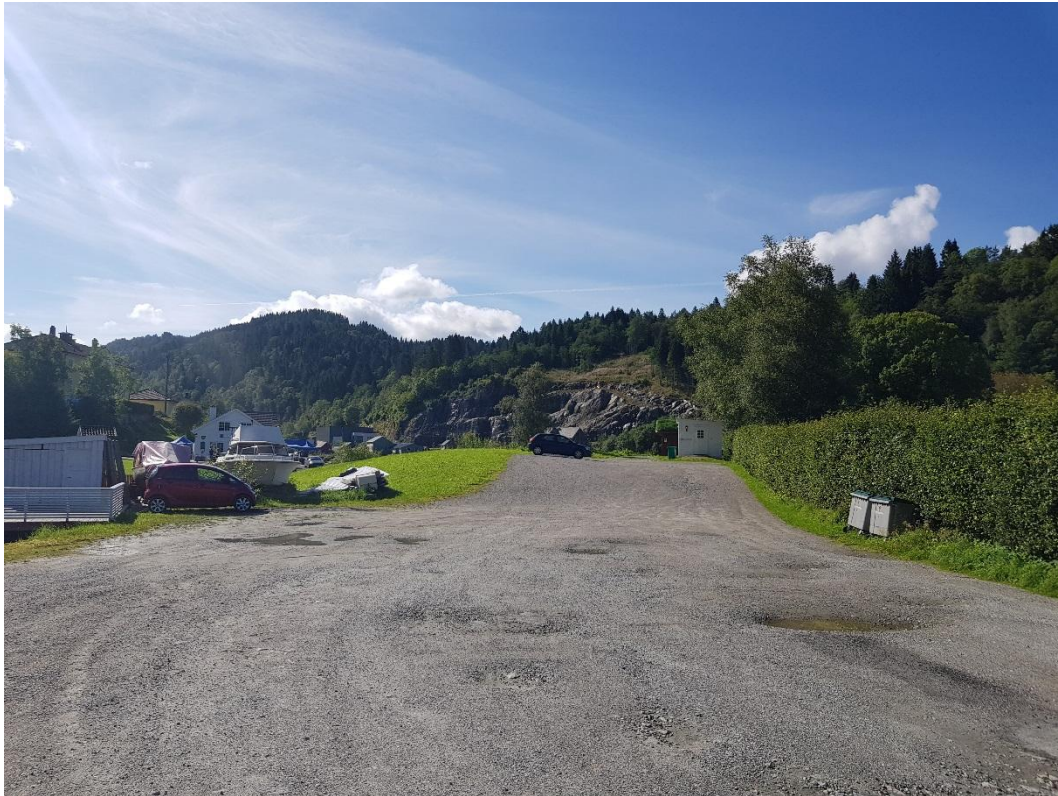
Biletet over visar utsikta frå punkt nr. 9, markert med olivengrøn farge, teke i på kyrkja sin parkeringsplass. Som ein ser så er fjellskjæringa veldig dominerande.