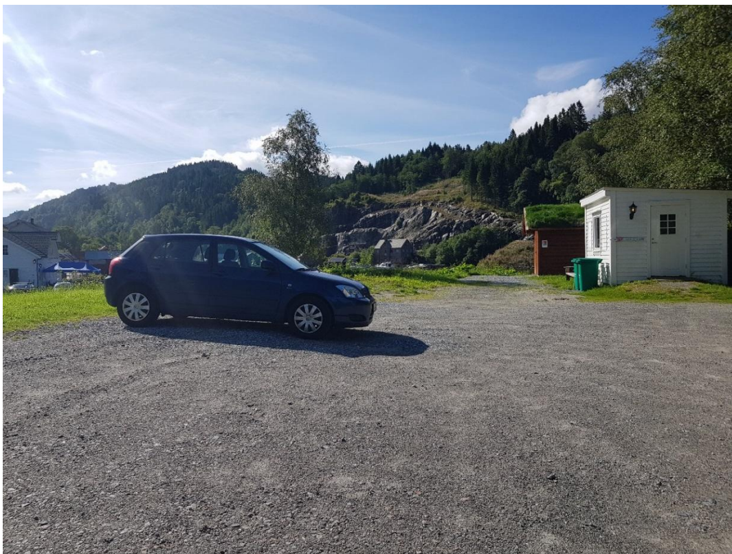
Biletet over visar utsikta frå punkt nr. 10, markert med grøn farge, teke i søre enden av kyrkja sin parkeringsplass. Også her ser ein kor dominerande fjellskjæringa er. Det er allereie begynt å gro fyllinga, dette vil bli enda betre når vi får lagt på eit skikkeleg jordlag og planta tre.