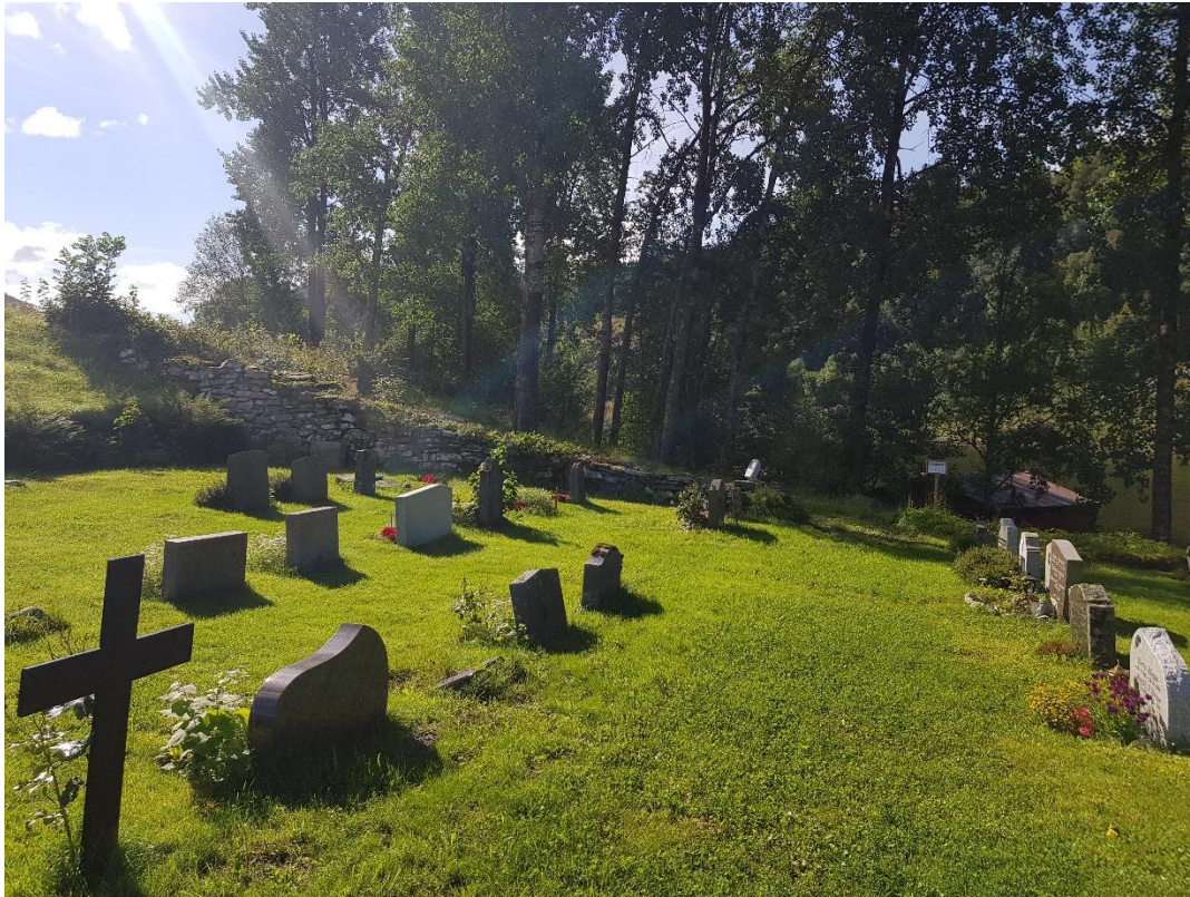
Biletet over visar utsikta frå punkt nr. 3, markert med rosa farge på framsida av kyrkja.