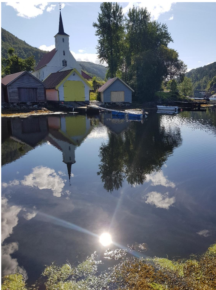
Biletet til venstre viser utsikta frå punkt nr. 4, markert med kvit farge nord for naustrekka mellom kyrkja og sjø på flyfotoet. Legg merke til det kvite nauset med gul dør foran kyrkja. Dette nauset er bygd dei siste åra. Betongkaien, med utliggjar, er etablert seinare. Nauset stenger også korridoren mellom sjø og kyrkja.