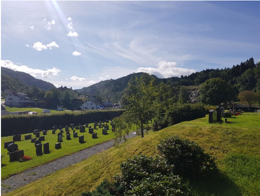
Biletet over visar utsikta frå punkt nr. 7, markert med marine blå farge ved inngangsporten til gravplassen.