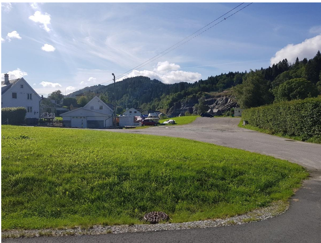
Biletet over visar utsikta frå punkt nr. 8, markert med blå farge, teke i avkjørselen til kyrkja sin parkeringsplass.