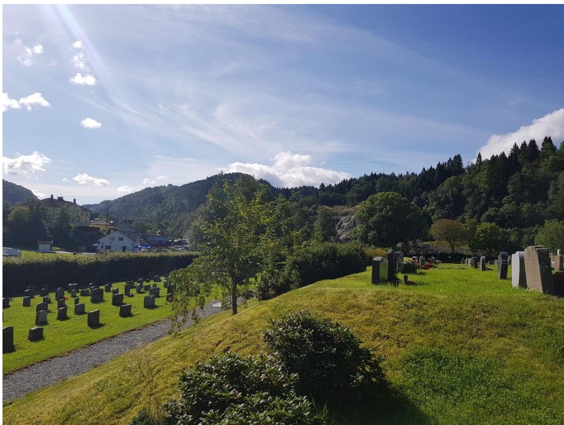
Biletet over visar utsikta frå punkt nr. 6, markert med turkis farge på det nordøstre hjørnet av kyrkja, litt lengre ned i adkomstvegen til kyrkja ifht bilde nr. 5.