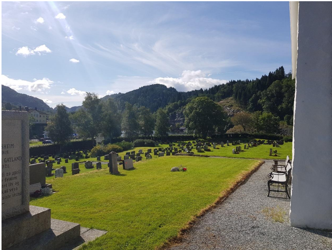
Biletet over visar utsikta frå punkt nr. 5, markert med raud farge på det nordøstre hjørnet av kyrkja.