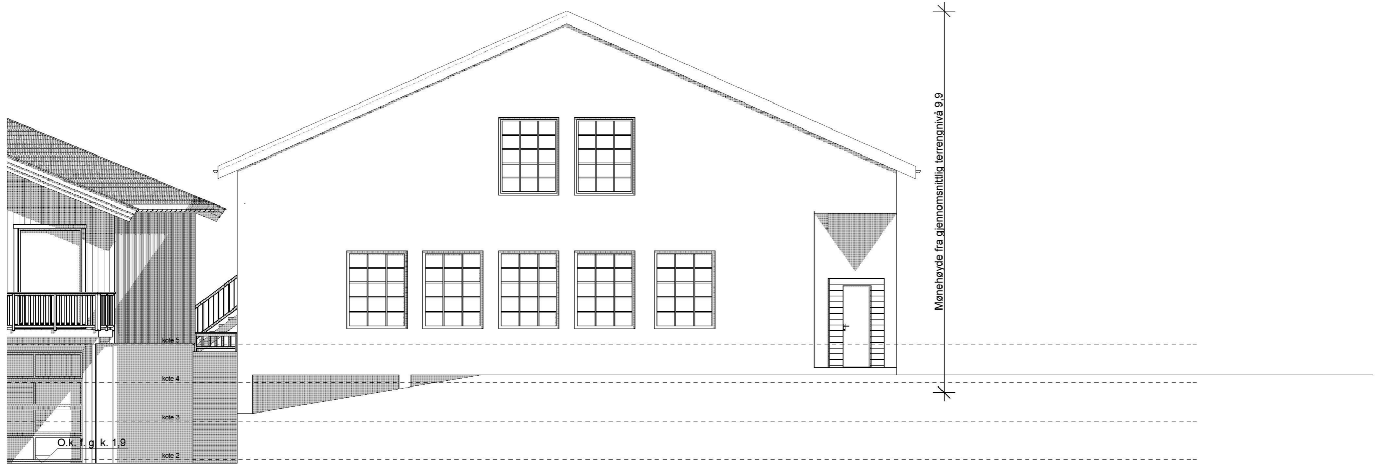
FASADE MOT SØRVEST