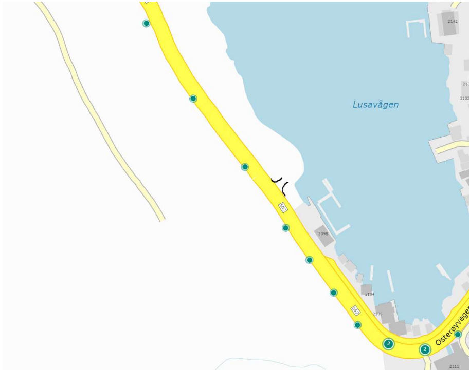
Bilde 3; Her ser man avkøyringa samt belysningspunkt på fylkesvegen. Avkøyringa har belysningspunkt i nærleiken og på begge sider. Utsnitt frå databasen til statens vegvesen.

Området ved avkøyringa er godt belyst med lysstolpar på begge sider av avkøyringa. Belysninga er noko meir omfattande på søraustsida av avkøyringa, men denne «smittar» også over på vår avkøyring og bidrar