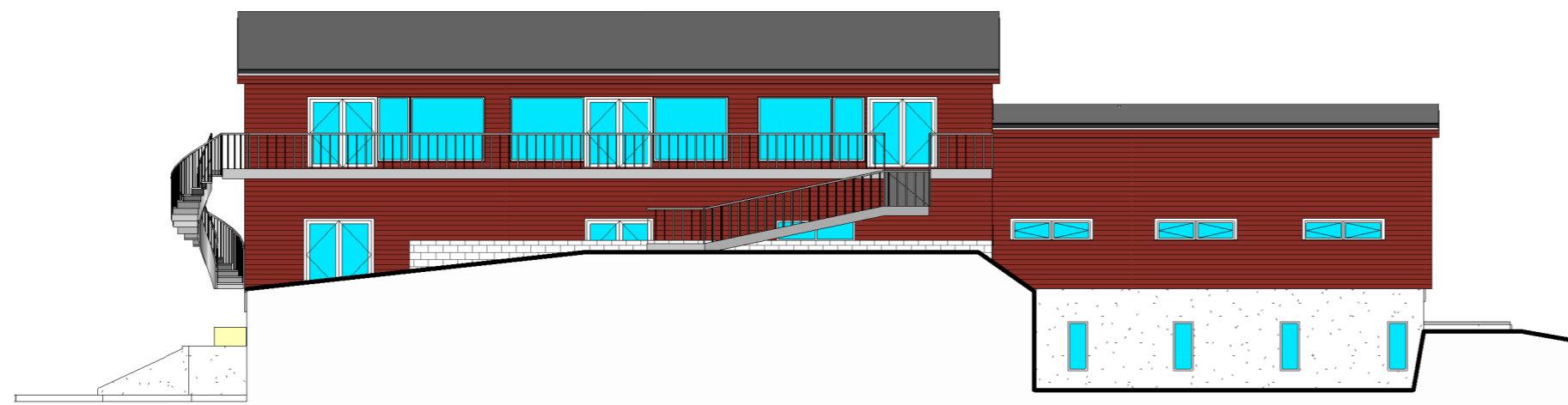
2 North 1 : 200