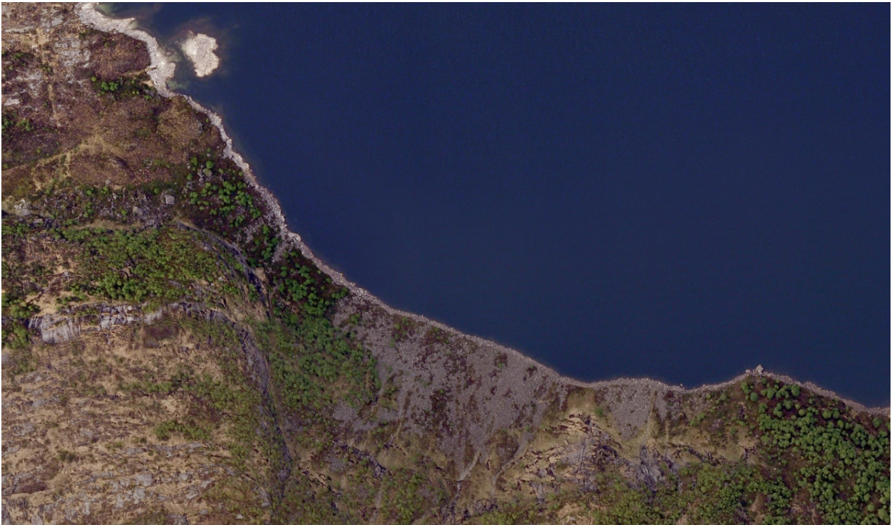
Ortofoto 2011, synleg steinsprang