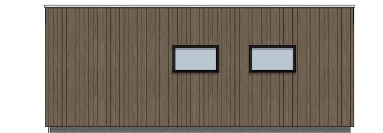
Fasade Øst 1:100