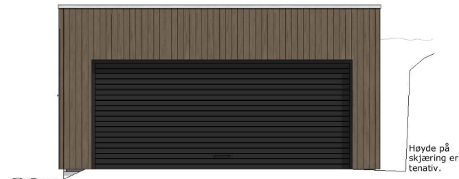
Fasade Nord 1:100