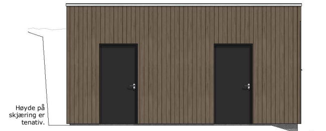
Fasade Sør 1:100