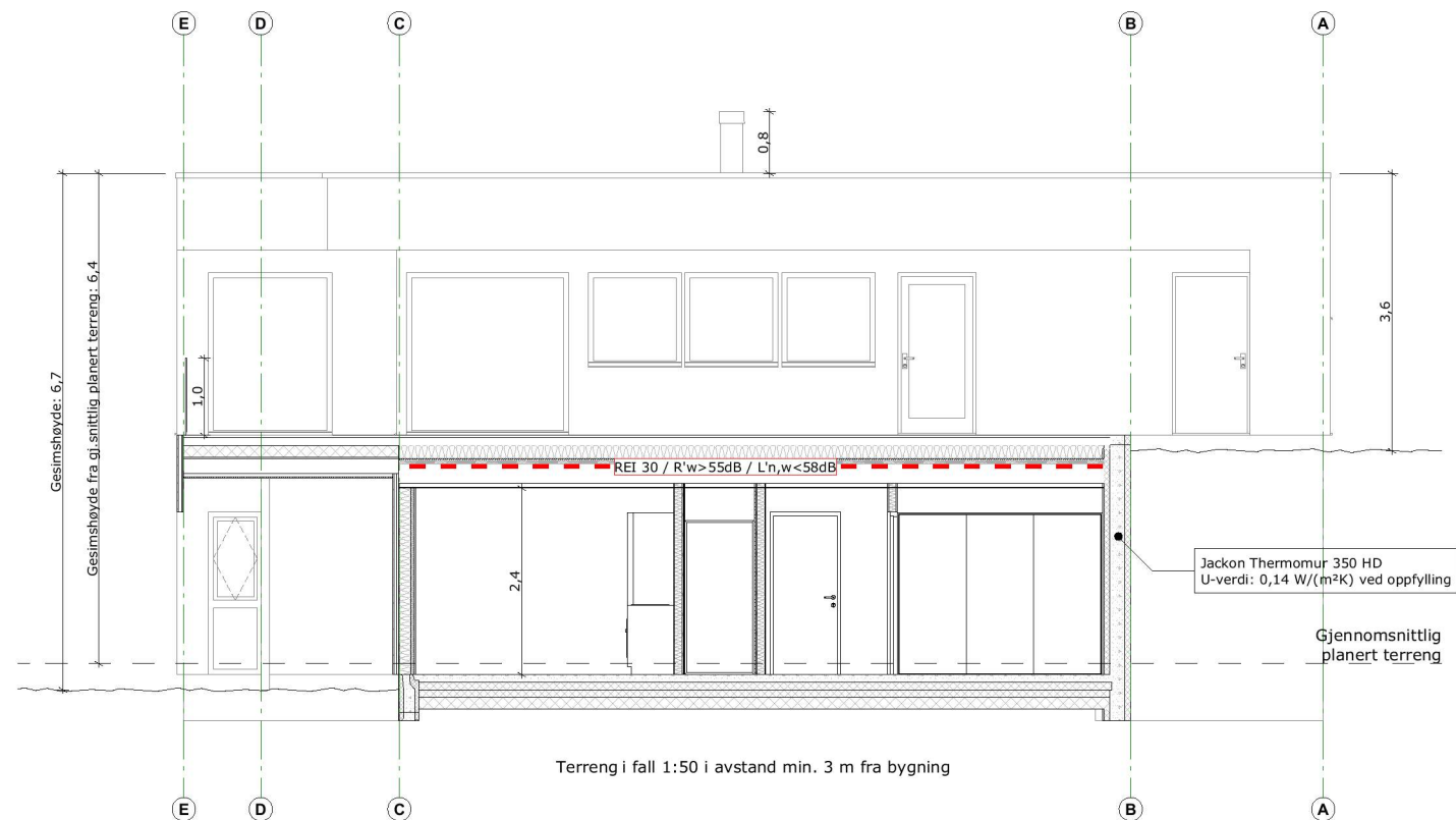
Snitt A 1:100