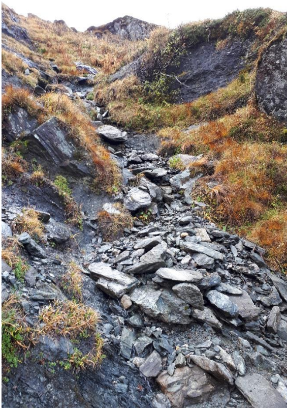
Breiare og breiare sti