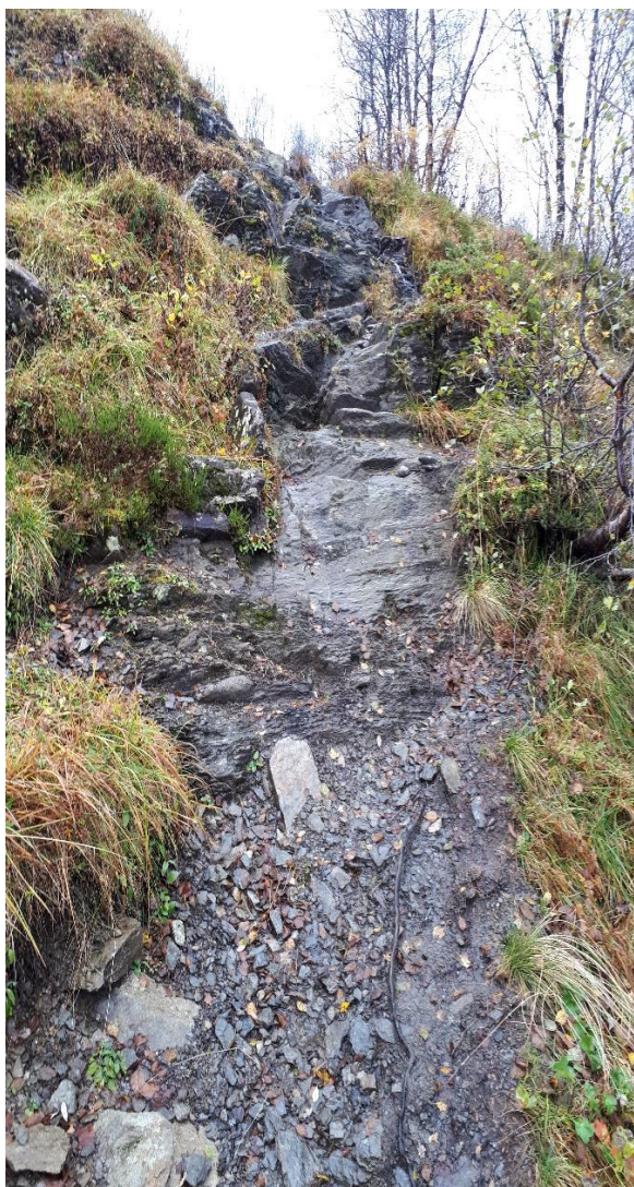
Stadig breiare sti