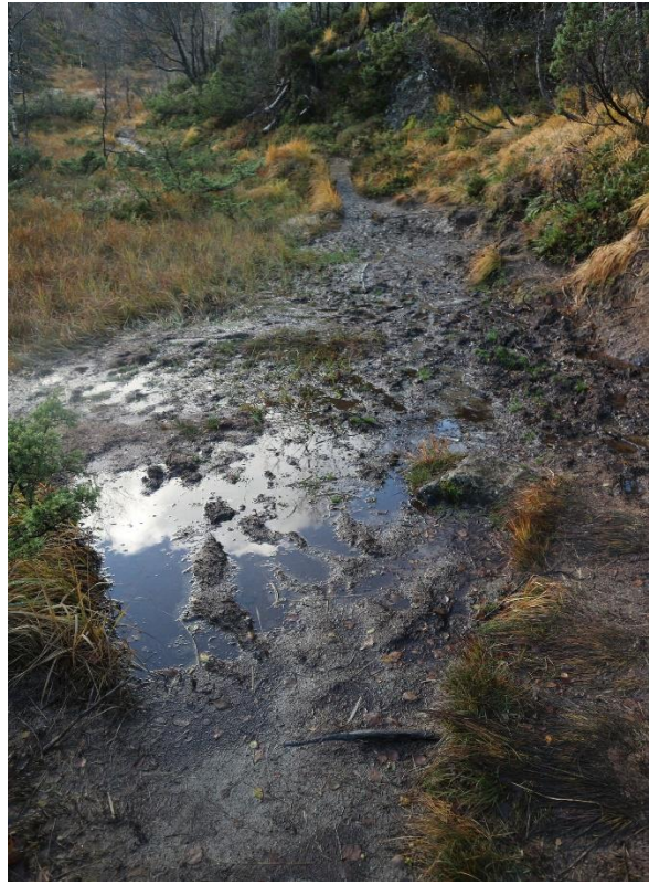
Våte parti med aukane erosjon.