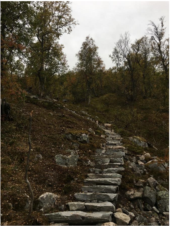
Eksempel på ferdige trapper.