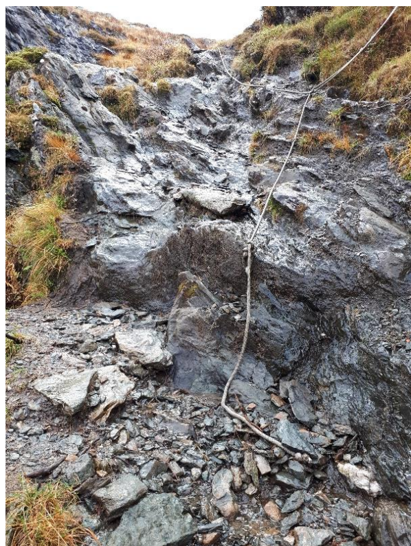
Vanskeleg passasje for eldre og barn