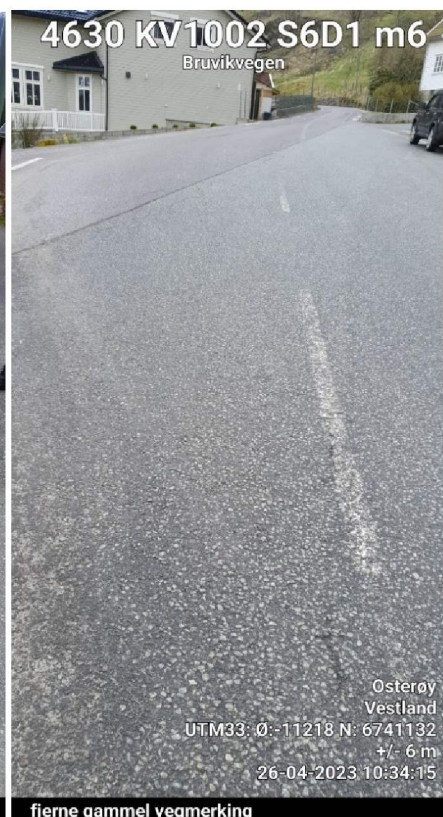
fjerne gammel vegmerking