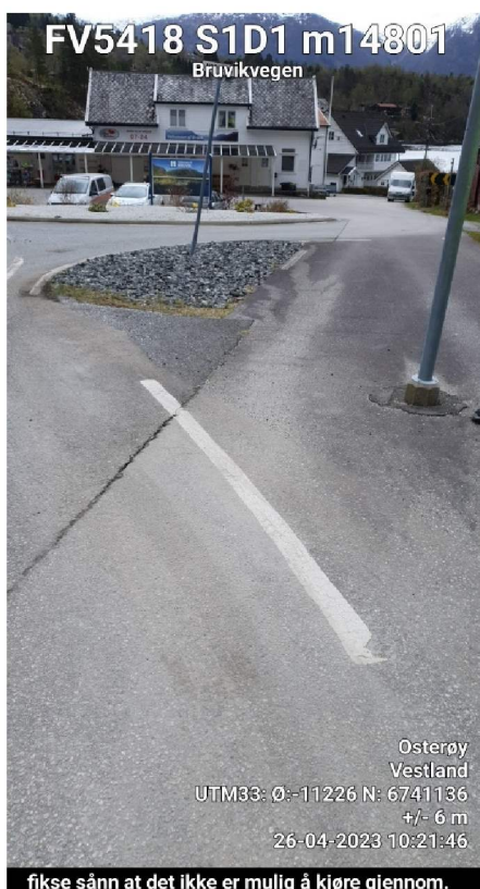
fikse sånn at det ikke er mulig å kjøre gjennom.