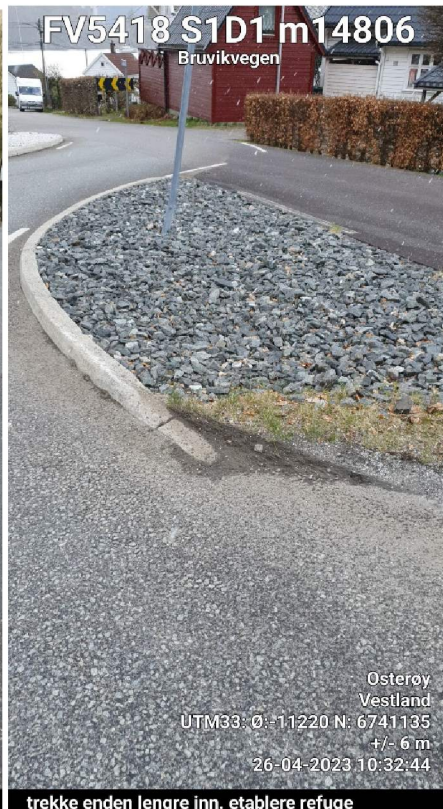
trekke enden lengre inn. etablere refuge