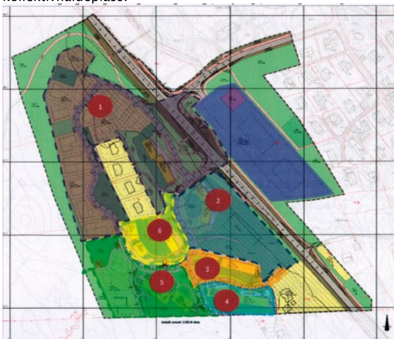
Figur: Reguleringsplankart med tenkt trinnvis utbygging lagt over.

Vi ser likevel at det ligg ved ei skisse til framlegget som kan tyde på at det er lagt ein plan for trinnvis utbygging av offentleg infrastruktur. Dersom det er forventa slik trinnvis utbygging må føresegnene vere eintydige, slik at det kjem fram kva utbyggingskrav som ligg til dei ulike trinna. Kartet skraverer berre delar av veganlegget, så det er uklart for oss kva ein ser for seg skal byggjast ut. Skraveringa omfattar mellom anna ikkje kanalisering av kryssområda, eller kollektivhaldeplass.