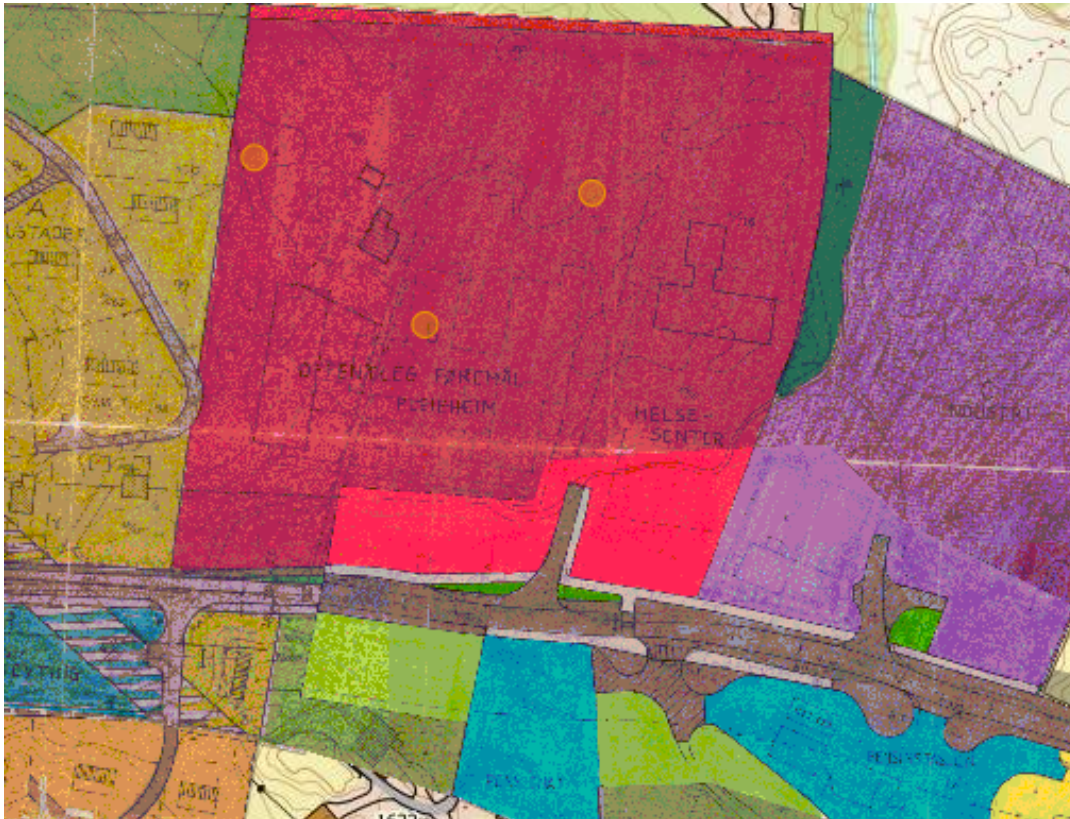
Utsnitt frå reguleringsplan for Hesthaugen

12601983000100, er definert som område for «offentleg føremål pleieheim/helsesenter». Eigedomen inngår også i reguleringsplan for Manger Sentrum, planid. 12602007000800, reguleringsplan for Radøy Auto, planid 12601989000200 og Kommunedelplan for Manger sentrum, planid. 12602007000700.