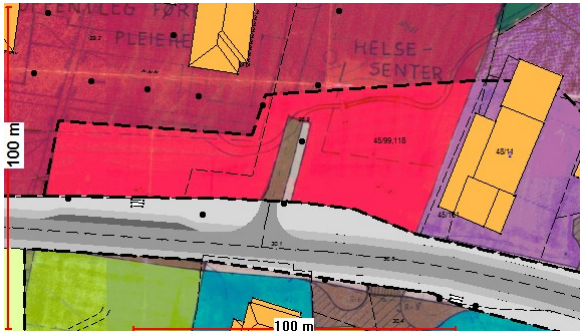
Utsnitt av reguleringsplan for Manger sentrum, Radøy auto og Hesthaugen

Avkjørsle til fylkesveg følger av reguleringsplan for Manger sentrum og reguleringsplan for Radøy auto.