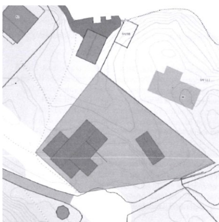
Situasjonsplan for tomte i følgje kommunen sitt vedtak.

Statens vegvesen syner til søknad om utvida bruk av avkøyrsele. Vi syner også til Radøy kommune sitt vedtak i Hovudutval for plan, teknisk og landbruk 07.03.2018 med vedtak om dispensasjon frå plankrav og løyve til oppretting av ny fritidseigedom. Sikta i avkøyrsla var nyleg utbetra i samband med frådeling av ein annan tomt i området