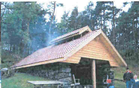
Grillhuset klar til bruk.