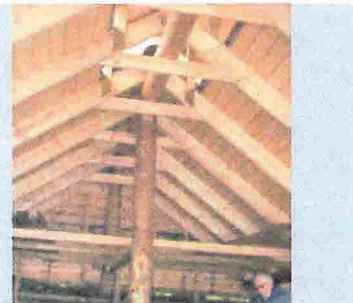
Klart for et pølsemåltid i grillhuset.