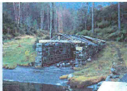
Naustmurene som skal bli grillhus.