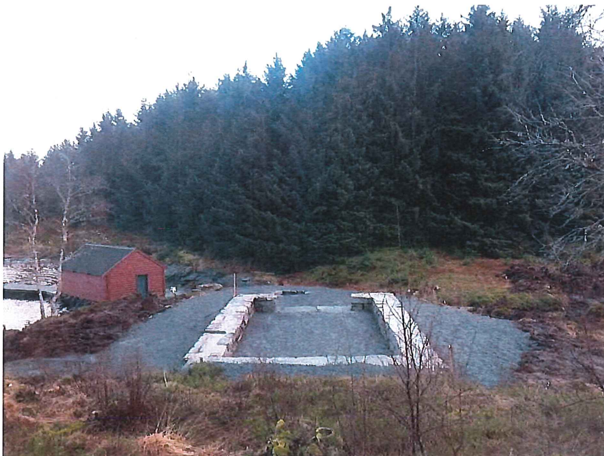
Bilde 4: Grunnmuren til grillhuset.