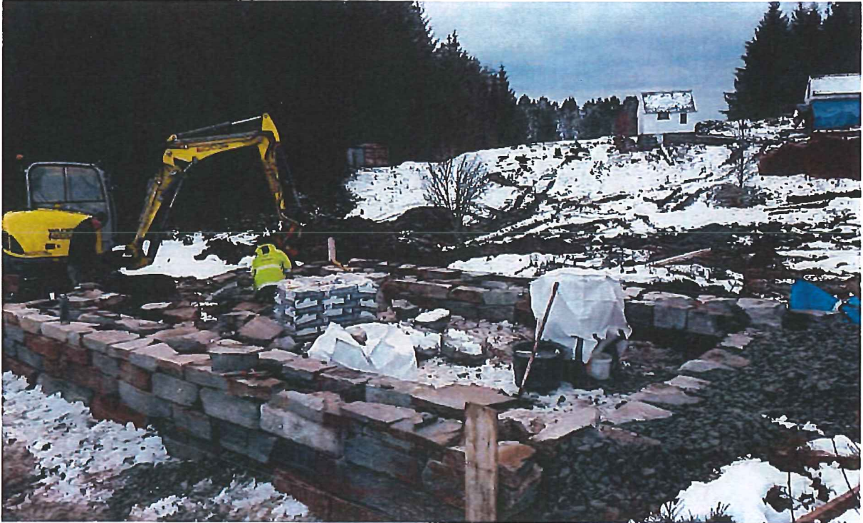
Bilde 3: Bygging av grillhuset.