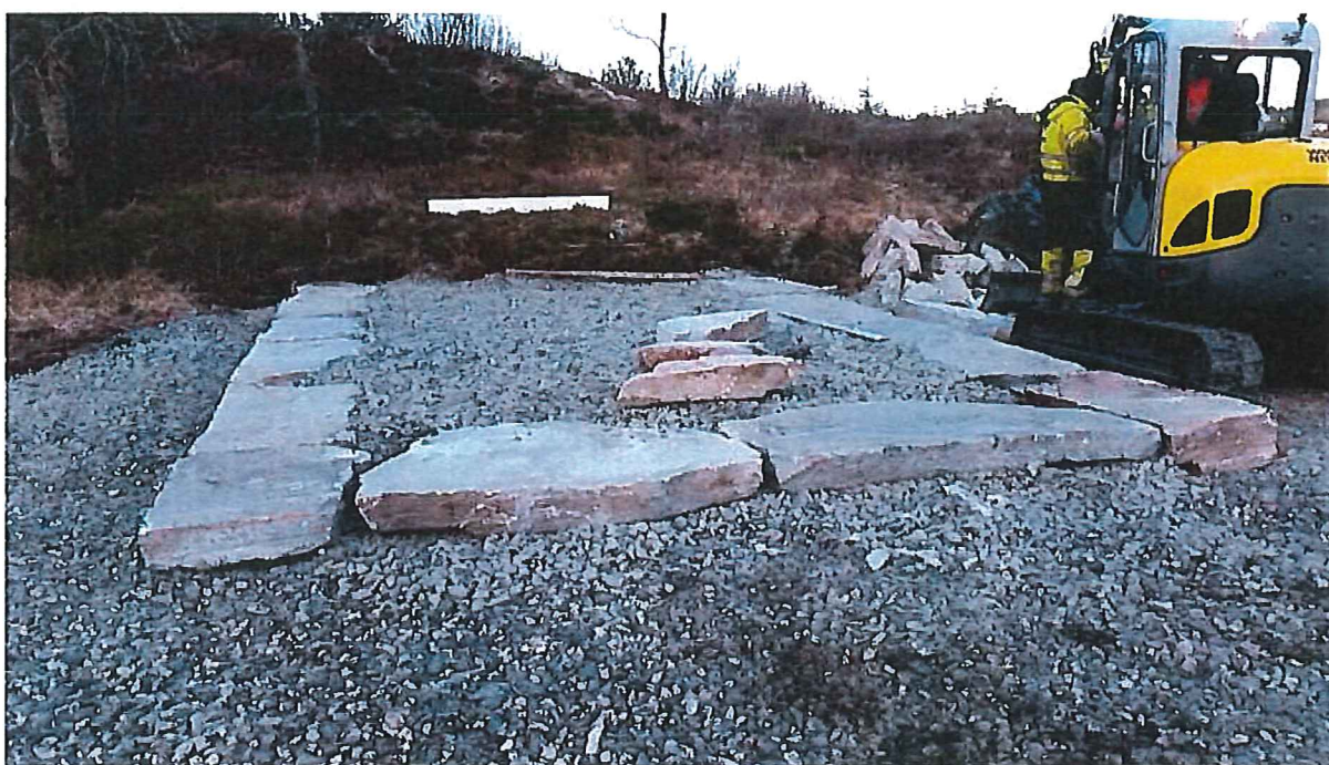
Bilde 2: Muring av platen til grillhuset.