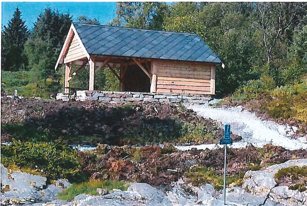
Bilde 1: Ferdig bygget grillhus.