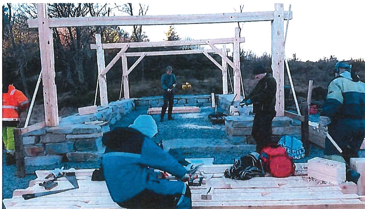
Bilde 5: Oppsetting av grillhuset.