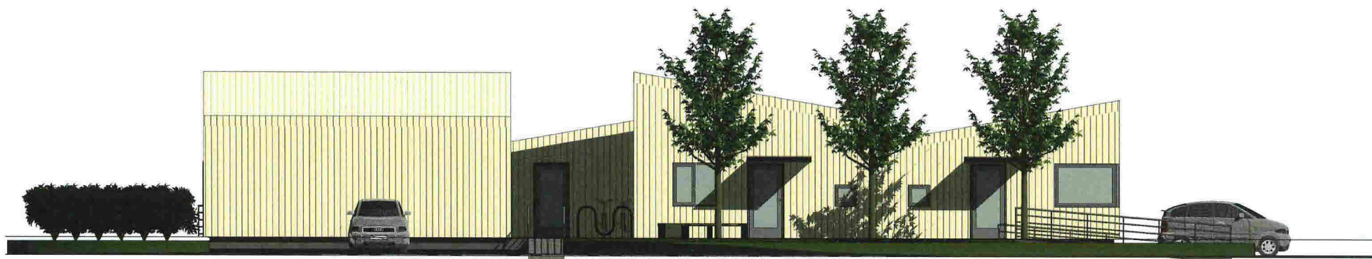
1 Nord-vest 1 : 100