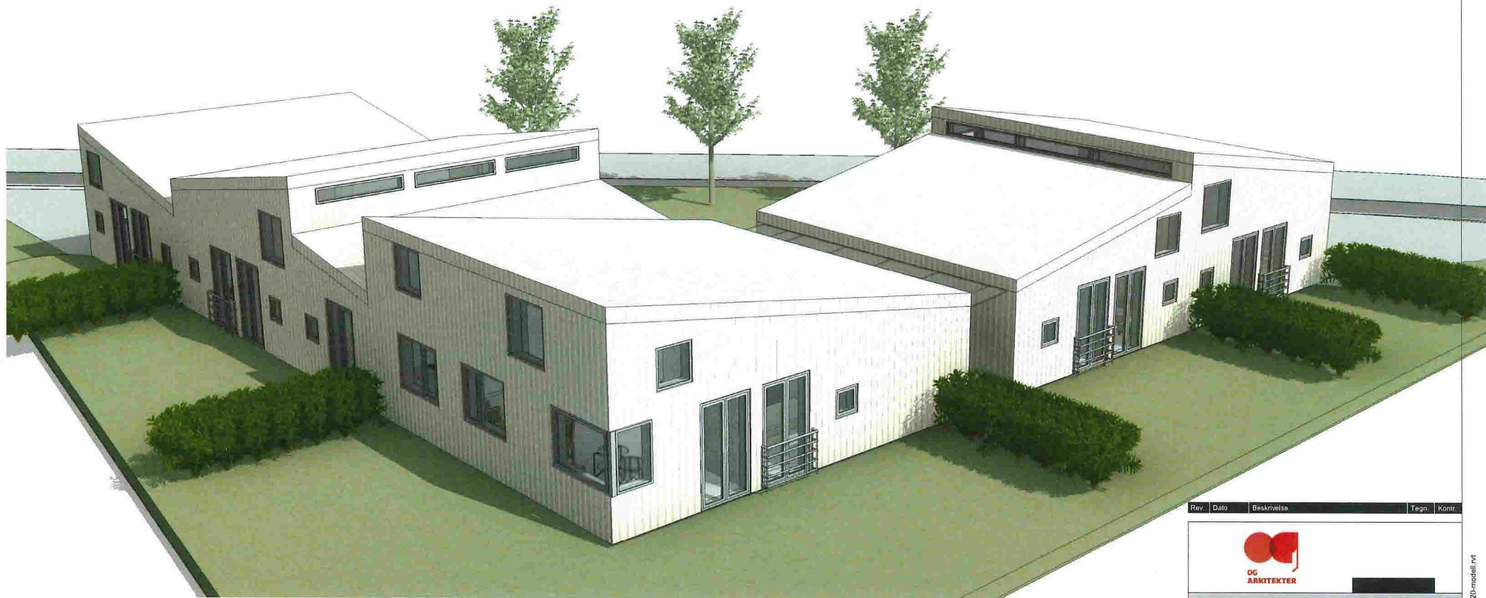
1 Perspektiv fra sør-vest