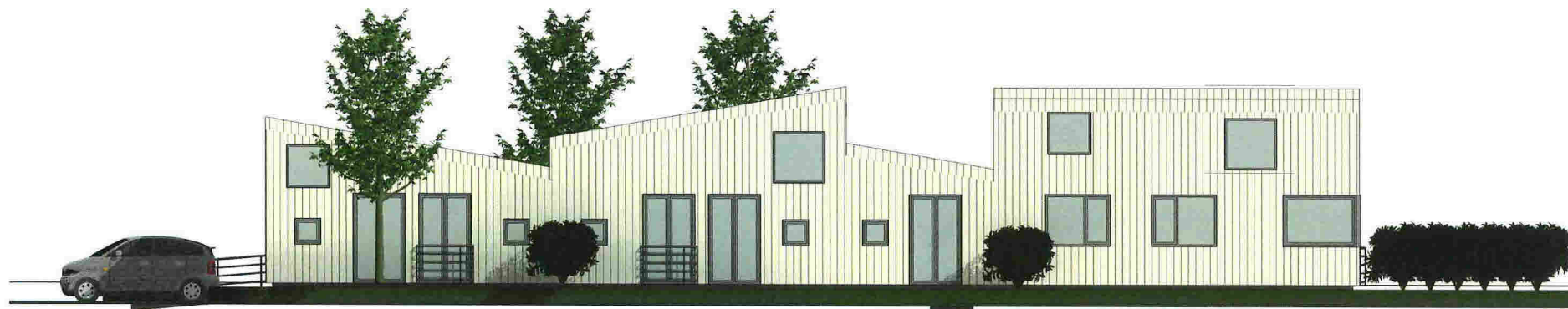
2 Sør-øst 1 : 100