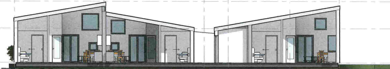
2 Snitt B-B 1 : 100