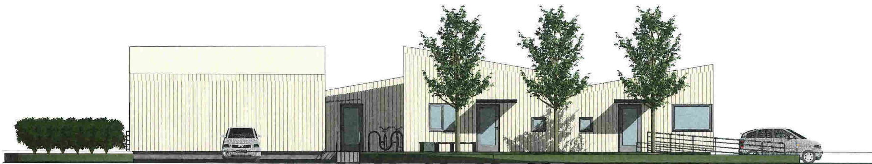
1 Nord-vest 1 : 100