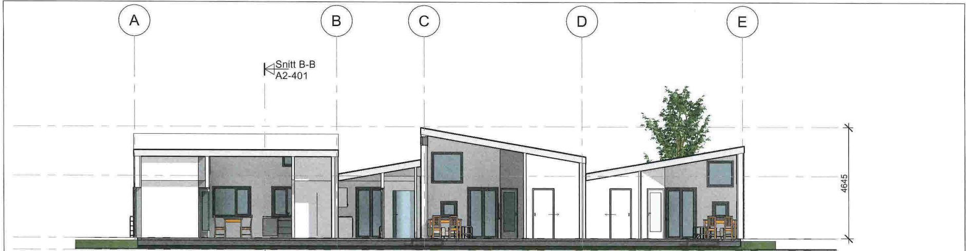
1 Snitt A-A 1 : 100