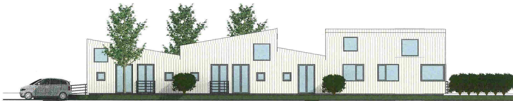
2 Sør-øst 1 : 100