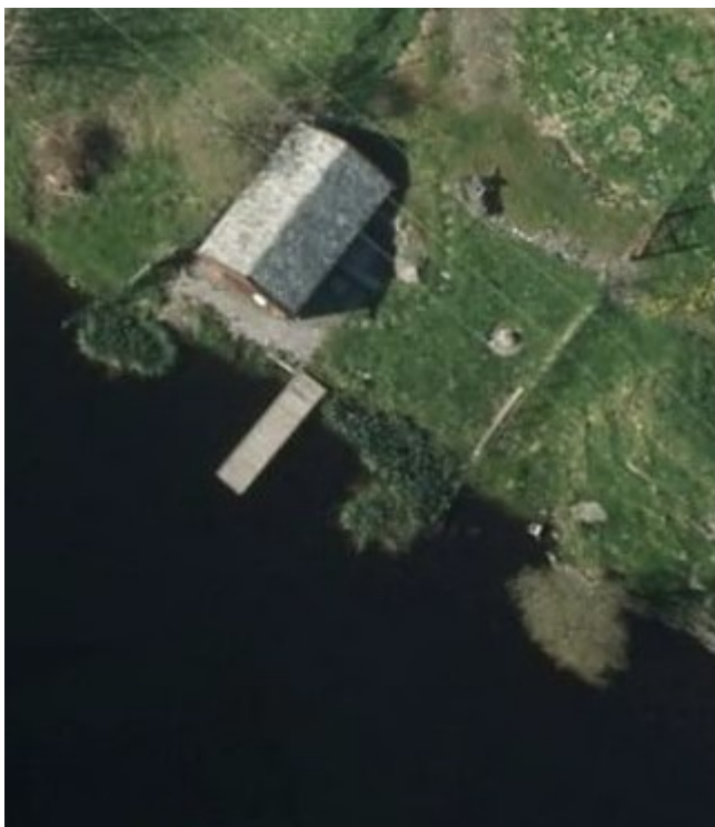
Flyfoto av flytebryggje og båtnaust/vedlager

Omsøkte tiltak vil få ein storleik med breidde på 1,4 meter x lengde på 5,7 meter.