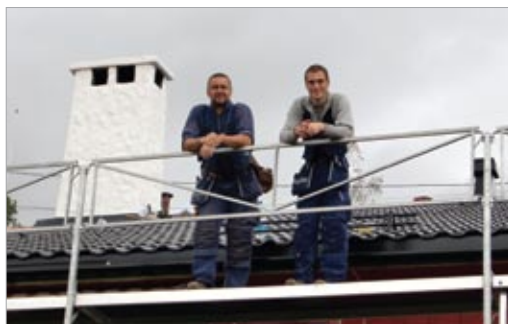
RADØY TAKSERVICE - Din taktekker og blikkenslager

Som autorisert DERBIGUM-entreprenør leverer vi takbelegg og membraner for alle typer flate tak og spesialanvendelser. Dessuten er vi medlem av TAKRINGEN, som er en landsdekkende kjede av selvstendige takentreprenører. Radøy Takservice er eneste bedrift i Nordhordland godkjent som lærebedrift i taktekkeryrket og har for tiden en lærling.