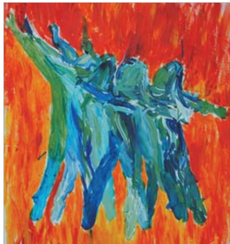
Teikning Marte Myksvoll