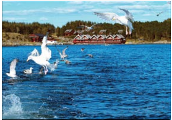
Dykkere i Hjeltefjorden.