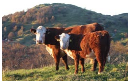
Kjøtte på beite.