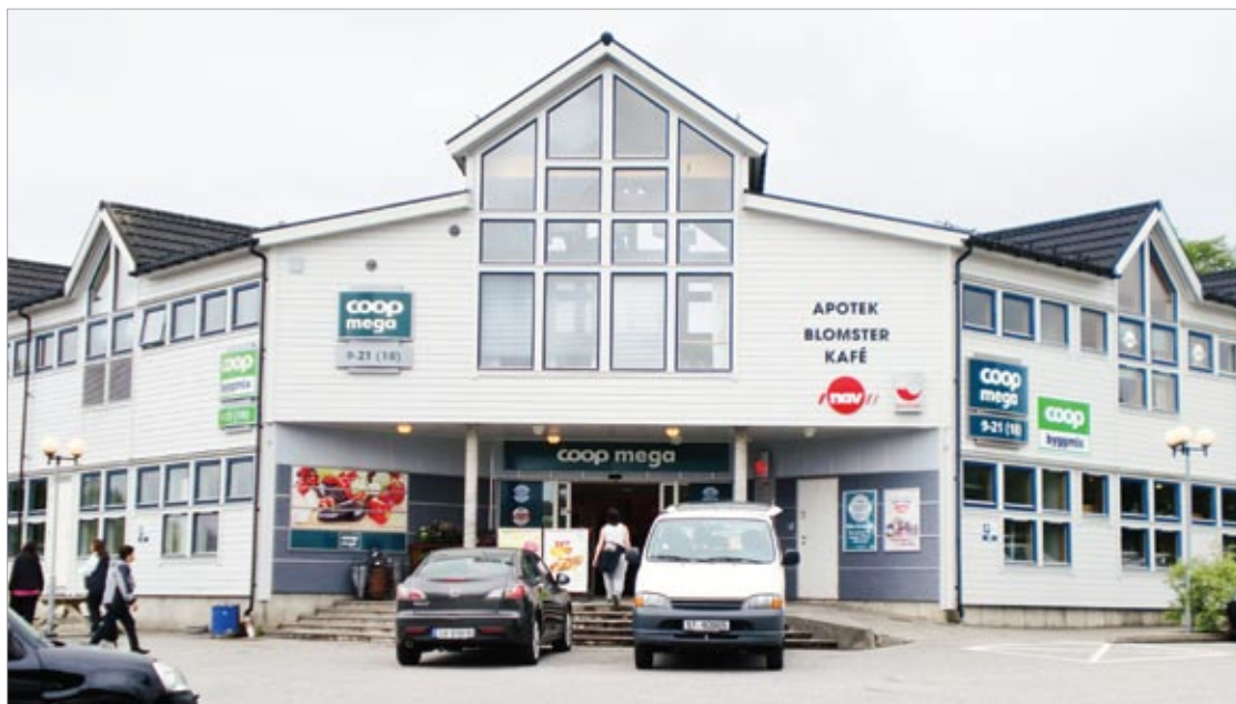
Manger senter.

Manger senter ligg i kommunesenteret i Radøy kommune. Me har pr i dag 10 butikkar, bensinstasjon, 2 verkstader og nokre andre serviceområde som ligg like ved senteret.