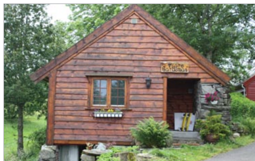
Uthuset i tunet.