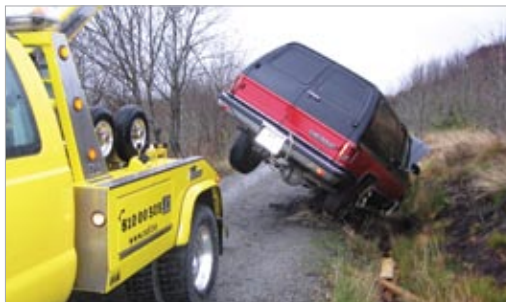
Chevrolet Blazer som hadde kjørt seg skikkelig fast, - men det gikk greit til slutt!