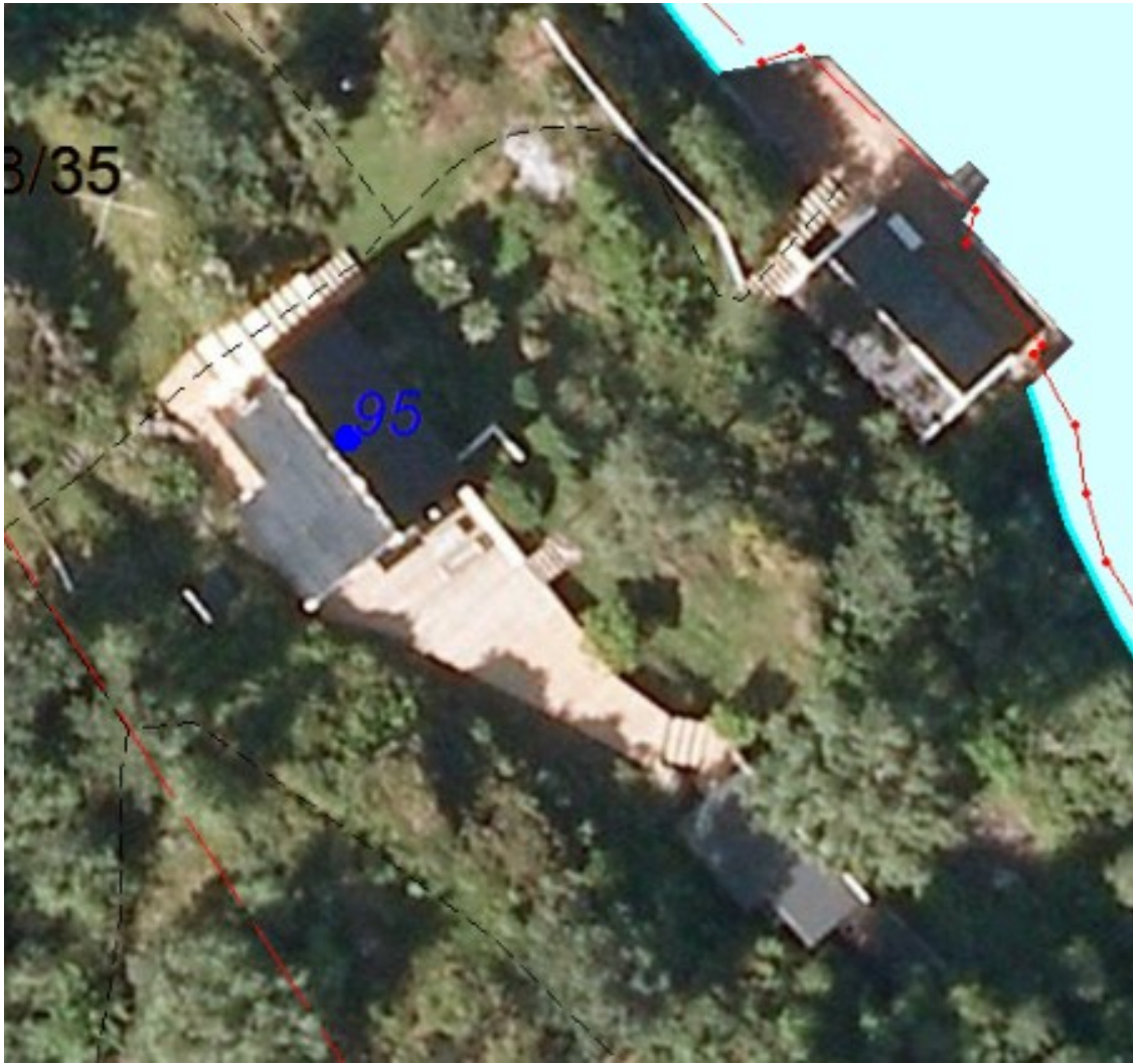
Foto: Ortofoto 2011