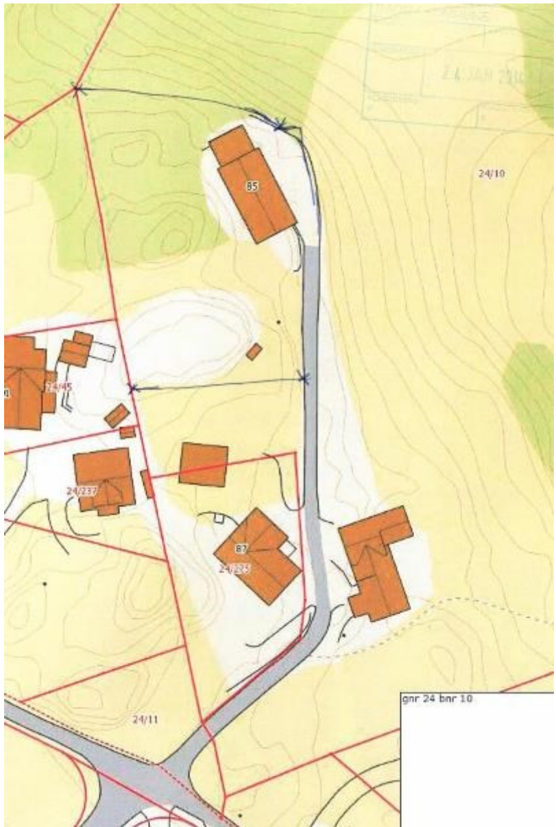
Bustadhuset på garden ligg rett bakom Hordabø skule.