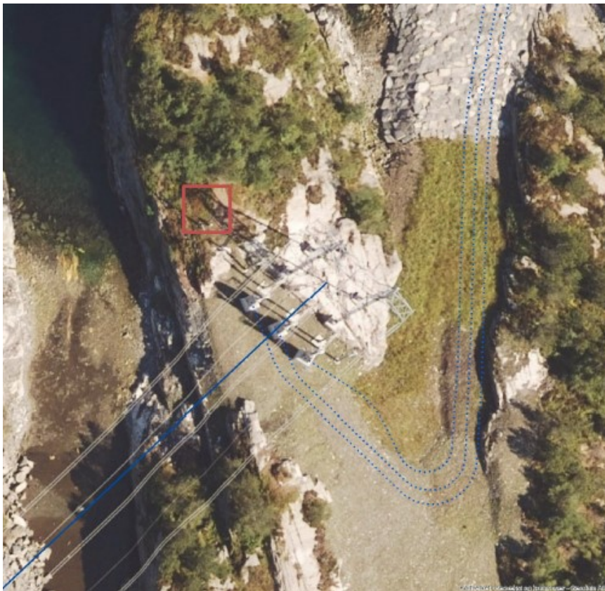
Figur 6 Ljøsøysundet