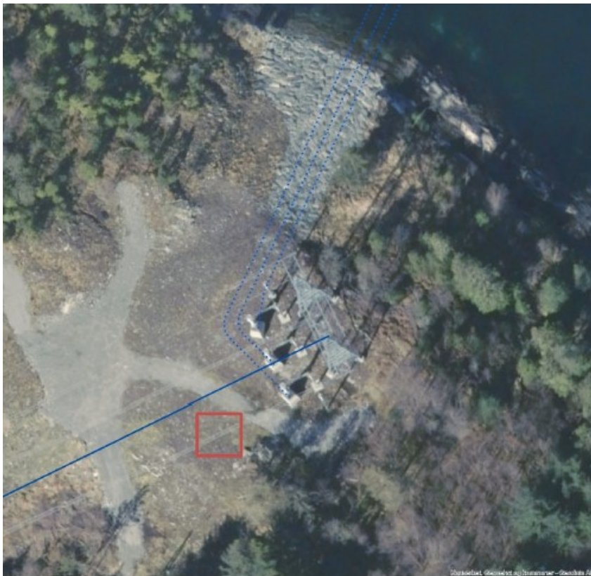
Figur 4 Saltvika