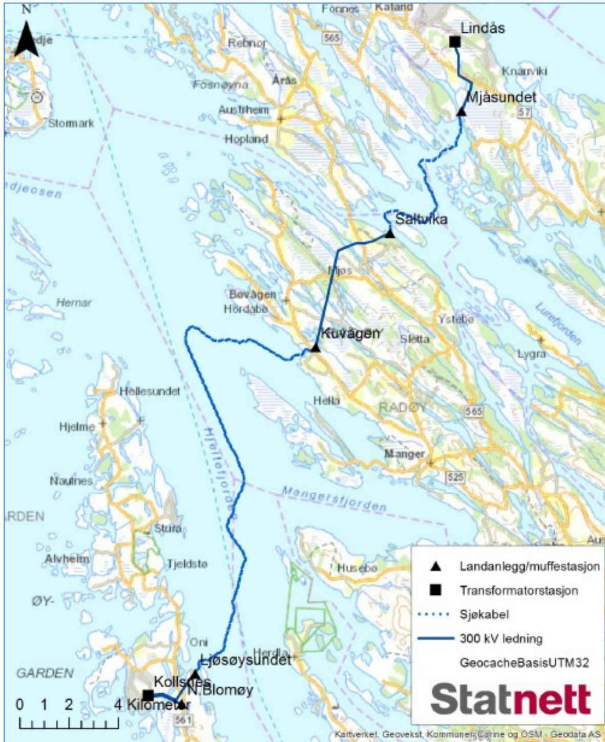
Figur 2 Oversiktskart med beliggenhet av muffeanlegg og teknikkhus