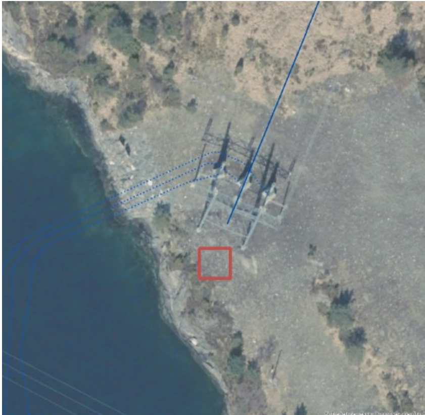
Figur 3 Mjåsundet