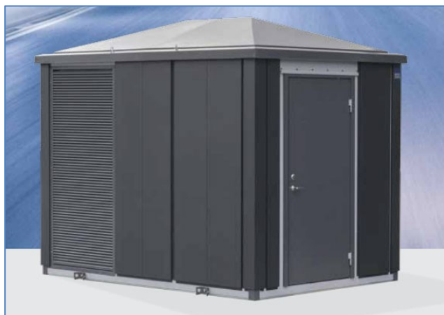
Figur 1 Fasade teknikkhus

Statnett søkte 11. september 2019 om tillatelse til å etablere fire teknikkhus i tilknytning til eksisterende muffeanlegg ved overgangene mellom luftledning og sjøkabel på ny 300 (420) kV kraftledning Kollsnes–Lindås. Byggene vil alle ligge på Statnetts eiendommer, med en grunnflate på ca. 7 m 2 og en høyde på 2,4 m, jf. vedlagte plantegninger. De vil plasseres rett ved eksisterende muffestasjoner, som består av tre stk. 4 m 2 fundamenter og 10 meter høye muffen. Anleggsarbeidet vil ta få dager per bygg. Til Kuvågen og Saltvika vil utstyret transporteres med lastebil på eksisterende vei, mens det vil benyttes helikoptertransport til Ljøsøysundet og Mjåsundet. Planen er å gjennomføre prosjektet vinteren 2019/20. Statnett beskriver virkningene av tiltakene for omgivelsene som små.