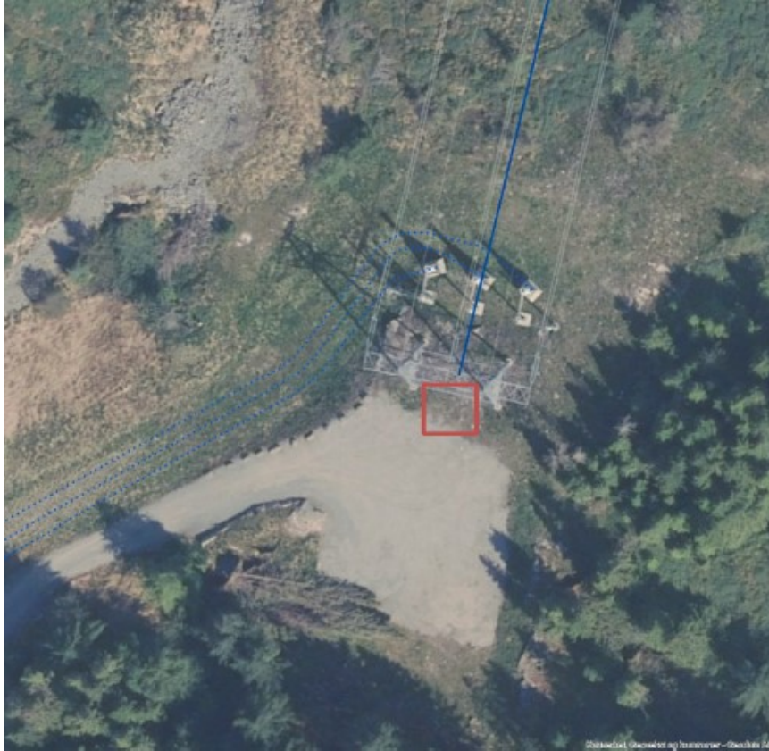
Figur 5 Kuvågen