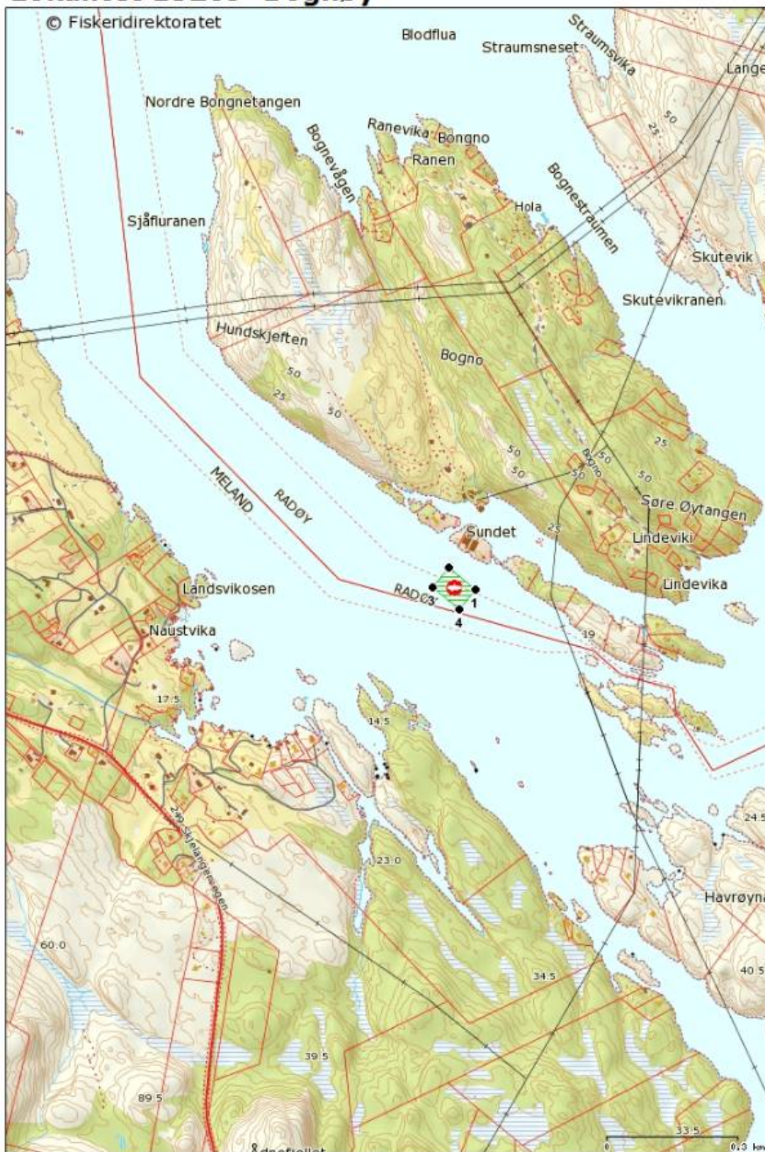
Målestokk: 1:10 000