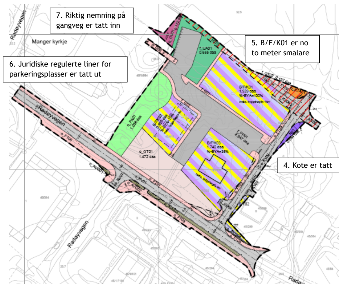
Figur 1 Oversikt over kva endringar som er ynskt.