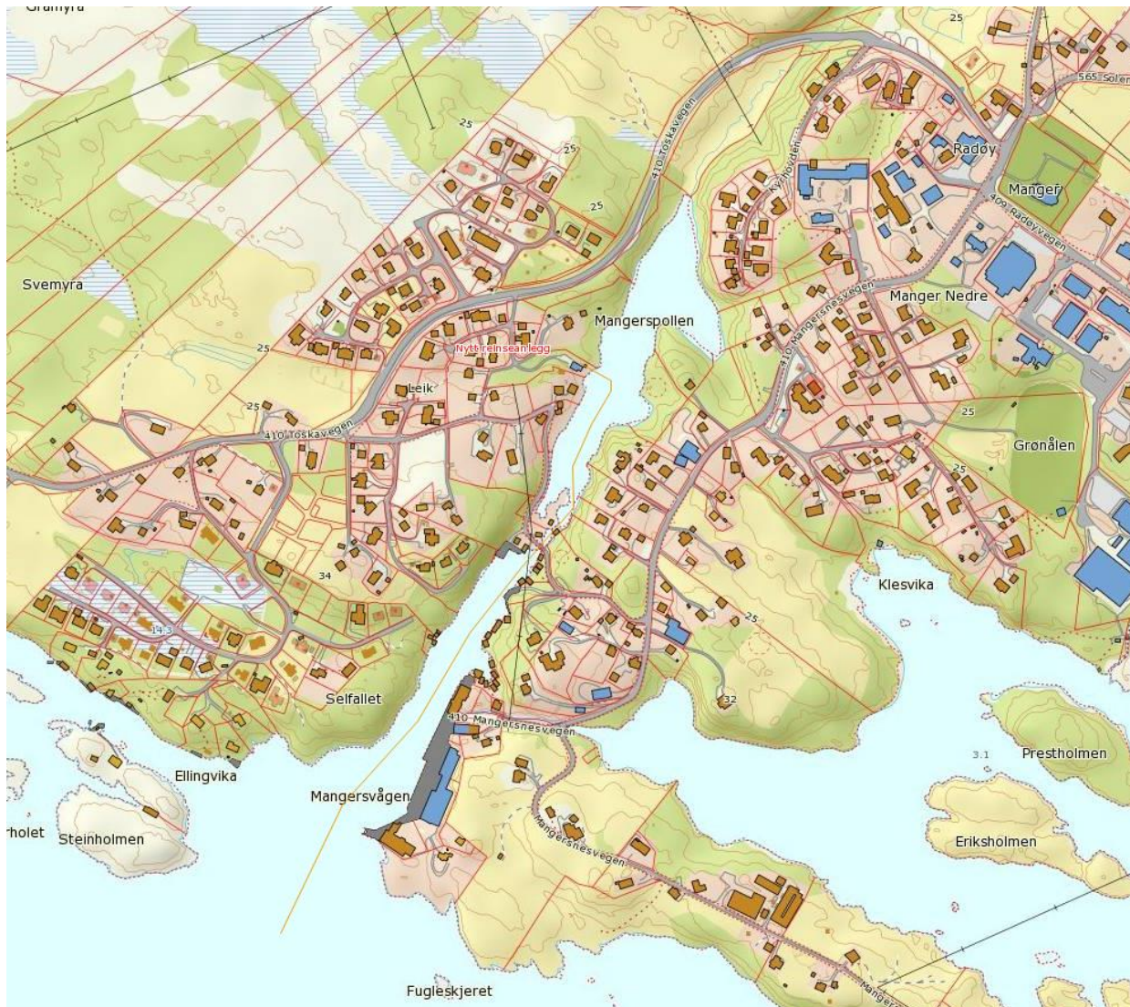
Figur 2 Plassering av reinsanlegget er ved Mangerspollen. Utsleppsleidningen er skissert inn.