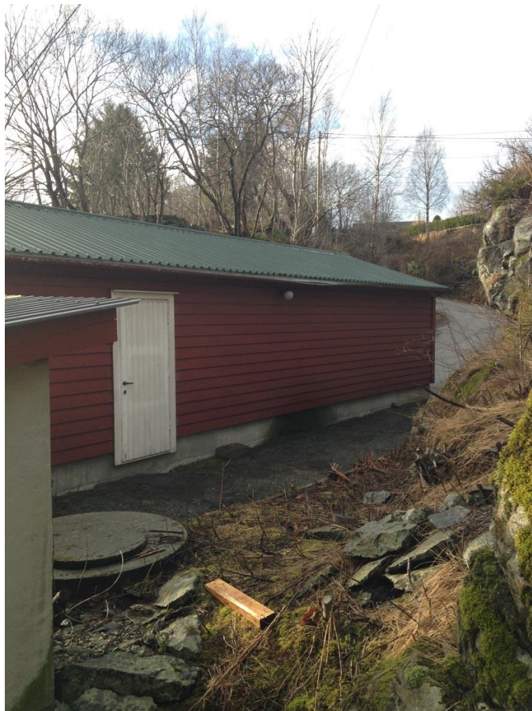
Figur 1 Plassering av reinseanlegg er der det i dag er ein slamavskiljar.