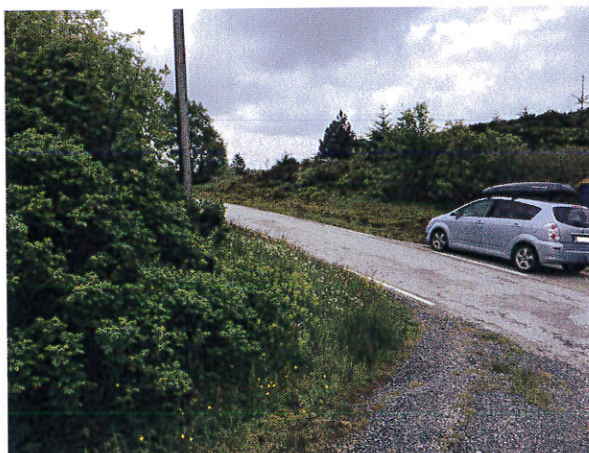
Figur 1: Sikt mot venstre

Vi var på synfaring på staden 11.06.2015. Planlagt tilkomstveg er, etter det vi kan sjå i plankartet, lagt i eksisterande tilkomstveg til bustadhuset på egedomen. Tilkomstvegen er bratt og det er dårleg sikt i avkøyrsla. For å få ei tilfredsstillande løysing på krysset må tilkomstvegen flyttast eller det må gjerast tiltak som sikrar god nok sikt og linjeføring i avkøyrsla. Det er særleg sikt mot venstre som må opparbeidast, sjå figur 1.