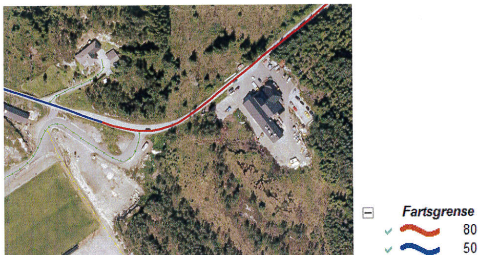
Fig. 1 Fartsgrense i området: raud 80 km/t, blå 50 km/t