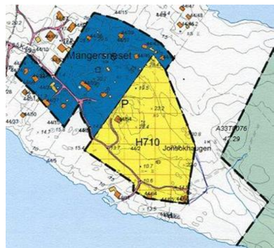
Kart vedlagt e-posten

«Vil bare informere om at området som er tenkt til boliger ikke lenger ligger som et LNF området i kommuneplanen. Område er endret til boligformål. Håper dette er oppklarende.»