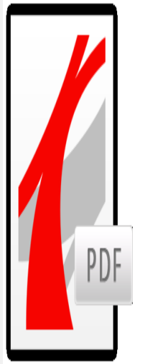
Alle fråsegn fr...