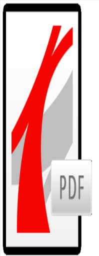
Søknad om NY mi...