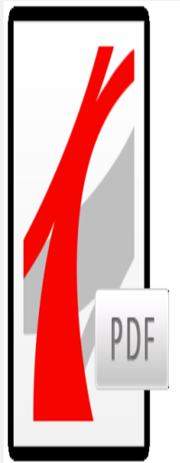
Varsling av min...